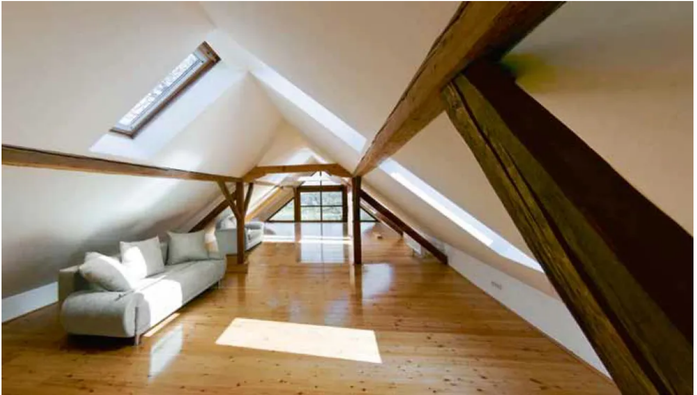
Integra UKF - 032

Aus der Serie ISOVER Integra ZKF/UKF: Zwischensparrendämmsysteme für Steildächer von SAINT-GOBAIN ISOVER