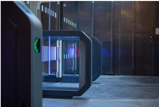
GalaxyGate im SWR, Stuttgart