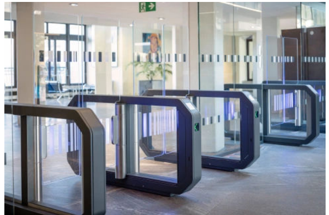
GalaxyGate im SWR, Stuttgart