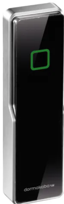
dormakaba Kompaktleser 91 04

Aus der Serie Systemlösungen für Zeit- und Zutrittskontrolle von dormakaba