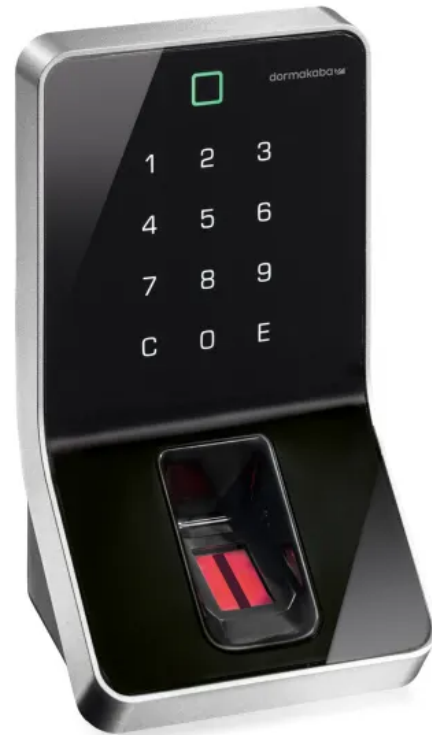
dormakaba Biometrieleser 91 50