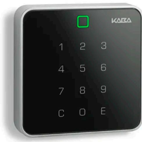
Kaba Erfassungseinheit 9002

Die Kaba Erfassungseinheit 90 02 mit verschleißfreier PIN Tastatur für Durchgänge mit erhöhten Sicherheitsanforderungen ist im Innen- oder geschützten Außenbereich einsetzbar. Die Bedienung der PIN-Tastatur wird durch „Guide by Light“ unterstützt. So kann sich beispielsweise ein Mitarbeiter identifizieren und eintreten. Einfach montierbar durch die schnelle 1-Click-Installation (quickwire). Unabhängig vom Montageort kann das dazugehörige Steuergerät an einem beliebigen, sabotagesicheren Ort installiert werden.