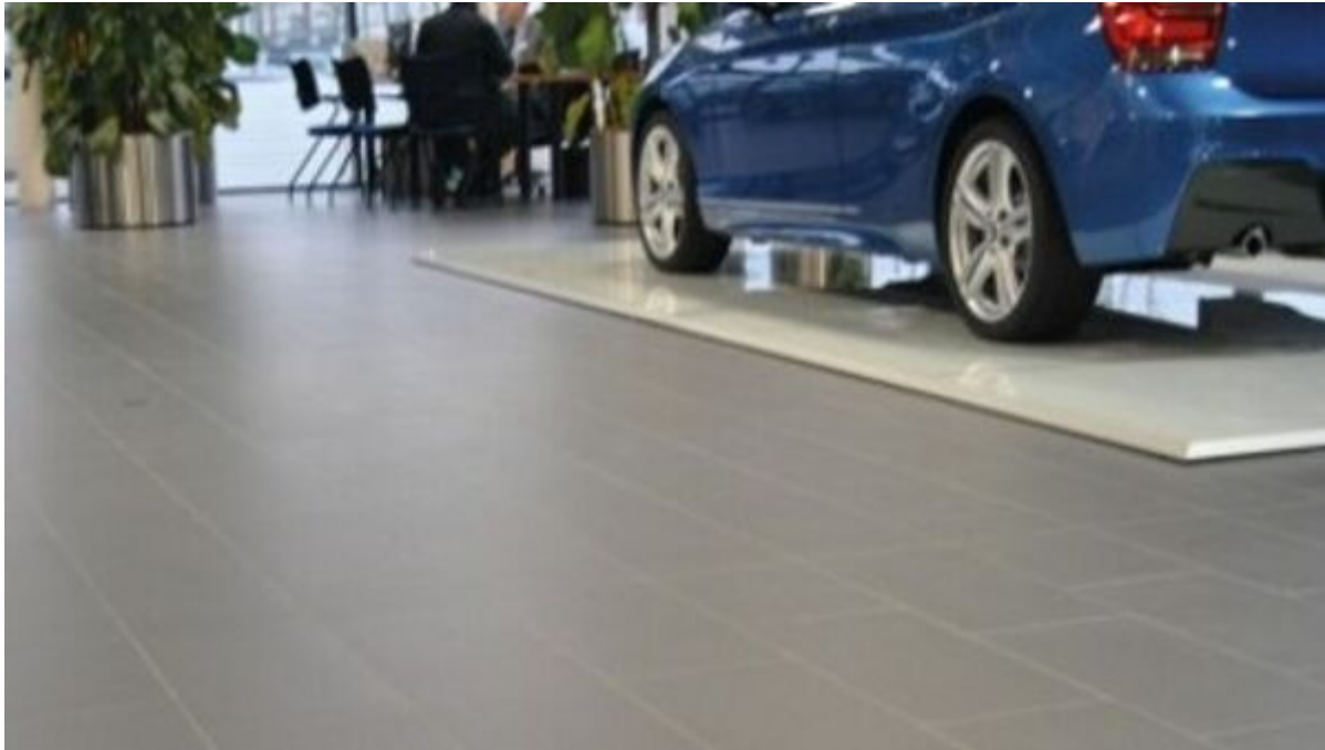
Injektionsflüssigkeit zum Rissverguss

Aus der Serie Produkte und Systeme für Fliesenverlegung von Saint-Gobain Weber