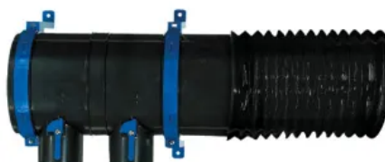
Plugg ExVent Abluftsammler

PluggExVent DHU regelt durch seinen eingebauten Feuchtesensor die Luftmenge automatisch.