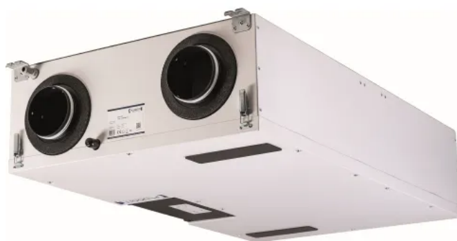
PluggEasy Decken- oder Wandgerät