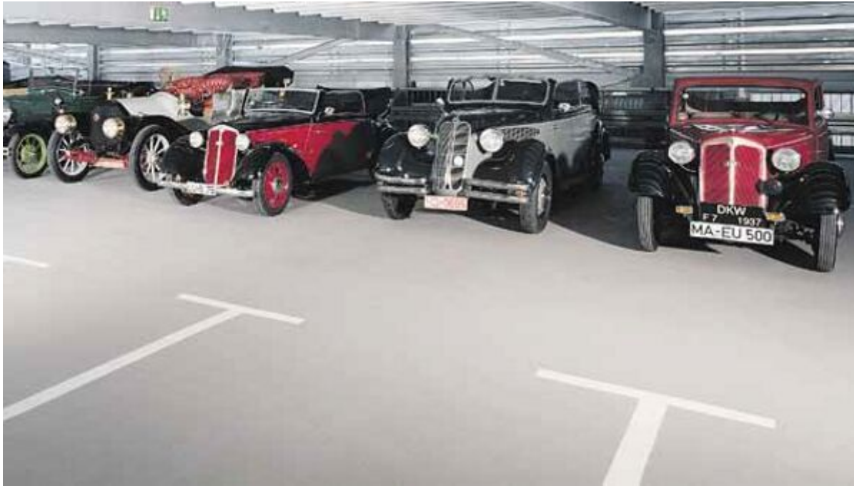
Zementgebundener Industrieboden, Ausgleichsmasse, Zementgebundene Industriebodenbeschichtung, Zementgebundener Industriebodenausgleich

Aus der Serie Bodensysteme von Saint-Gobain Weber