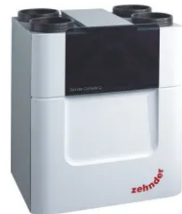
Komfort-Lüftungsgerät ComfoAir Q