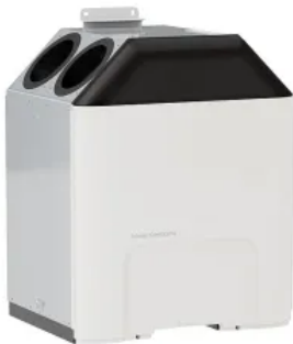
Zehnder Kühleinheit ComfoClima Cool