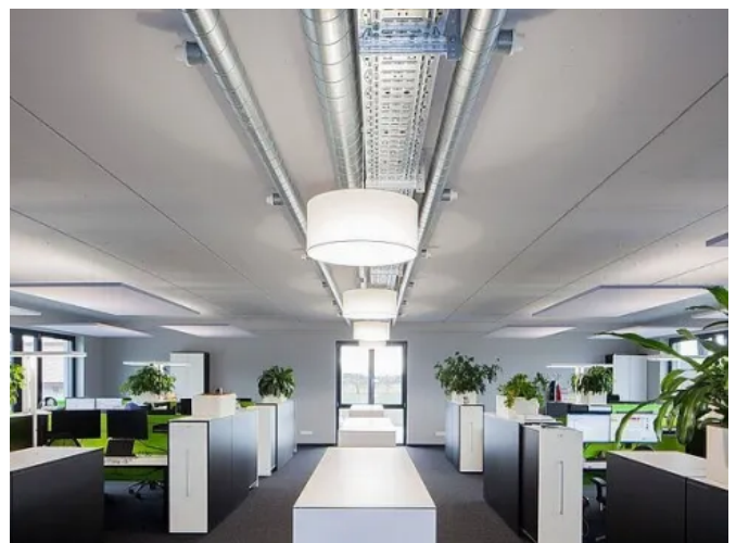
Lüftungssysteme für Büroräume – flexibel, effizient und wartungsarm