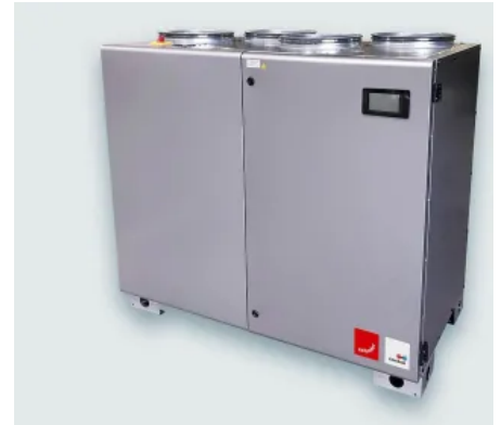
Lüftungsgeräte Zehnder Silvertop

Die EUROVENT-zertifizierten Lüftungsgeräte sind aufgrund der oben angeordneten Kanalstutzen sehr platzsparend installierbar und bieten eine Vielzahl an Geräteoptionen. Dadurch eignen sich die Lüftungsgeräte für unterschiedlichste Anwendungen wie Verkaufsräume, Schulen, Kitas, Büros, Arztpraxen usw. Die integrierte Regelung wird abhängig von der bestellten Gerätevariante im Werk parametrisiert. Schnittstellen in die Gebäudeleittechnik (Modbus, BACnet und WEB) sind als Standard enthalten. Mit dem modulierenden Bypass kann der Wärmetauscher für den Frostschutz oder für die freie Kühlung umgangen werden.