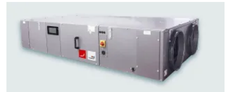
Lüftungsgeräte Zehnder NEOTIME

Die EUROVENT-zertifizierten Lüftungsgeräte sind für eine flache Montage konstruiert und damit ideal für Einbau in einer abgehängten Decke, alternativ flach auf dem Boden liegend. Der Einsatz erfolgt für unterschiedliche Anwendungen, wie Büros, Verwaltung, soziale Einrichtungen, Arztpraxen, usw. Die integrierte Regelung wird abhängig von der bestellten Gerätevariante im Werk parametrisiert. Schnittstellen in die Gebäudeleittechnik (Modbus, BACnet und WEB) sind als Standard enthalten.