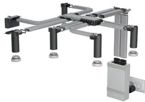
Lüftungslösung mit Zehnder ComfoAir Fit 100

Dank geringer Abmessungen kann das zentrale Lüftungsgerät sowohl in der Decke als auch im Aufputz, wandintegriert oder auf dem Balkon installiert werden.