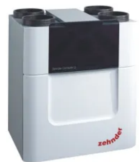
Komfort-Lüftungsgerät ComfoAir Q600 ST