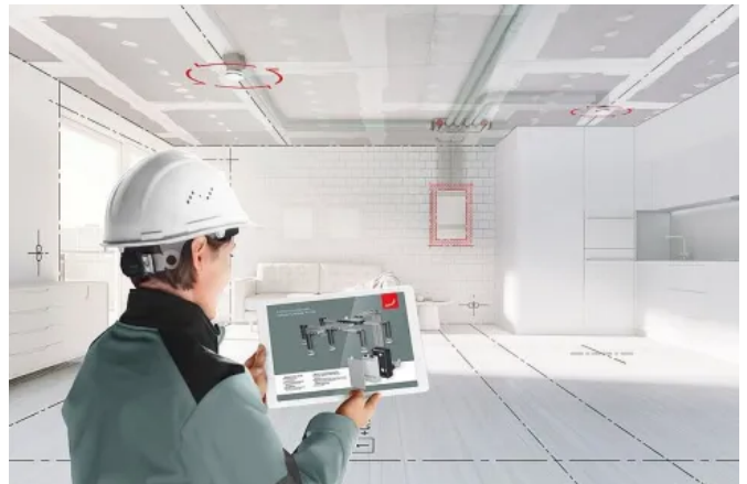
Serielles Sanieren mit Zehnder Lüftungslösungen

Verschärfte Baunormen und Gesetze sowie der Wunsch nach klimaschonenden Häusern führen zu immer energieeffizienteren Neubauten, deren Dämmungen den aktiven Austausch von Frischluft verhindern. Lüftungsgeräte schaffen hier Abhilfe und sorgen durch kontinuierlich gesteuerten Luftaustausch für eine bessere Wohngesundheit. Allerdings herrscht besonders bei der Planung und dem Bau von Mehrfamilienhäusern ein hoher Kostendruck. Eine Lösung bietet hier das serielle Sanieren – ergänzt durch Zehnder Lüftungslösungen.