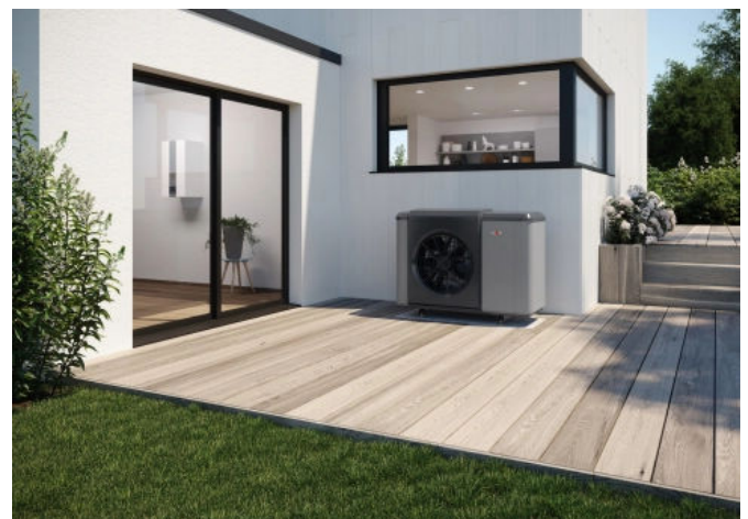
Luft/Wasser-Wärmepumpe CHA-Monoblock, Außenmodul

Sie bietet einen intelligenten Hybridbetrieb mit fossilen Wärmeerzeugern in ökologischer oder ökonomischer Betriebsweise. Ein hydraulischer und elektrischer Anschluss ist unter- oder rückseitig innerhalb von wenigen Minuten ohne zusätzliches Zubehör realisierbar. Das stabile Gehäuse besitzt eine UV-beständige Pulverlackbeschichtung.