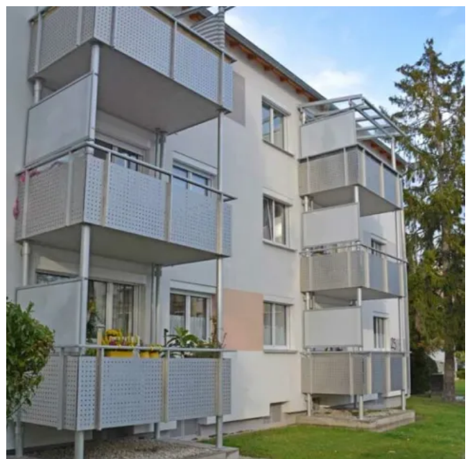
Anbau-Balkonsystem Modula 400

Broschüre zum Download: Anbau-Balkonsystem Modula 400