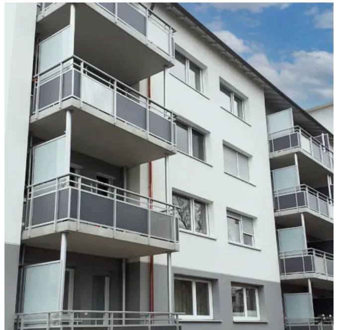
Anbau-Balkonsystem Modula 400