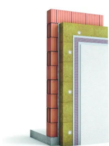
weber.therm A 100 WDVS

Technisches Merkblatt weber.therm A 100 WDVS