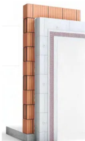
weber.therm A 150 WDVS

Technisches Merkblatt weber.therm A 100 WDVS