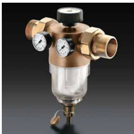
Rückspülfilter „Aquanova Compact R“