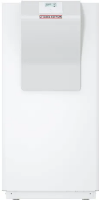
WPW-I 07/ 10/ 12/ 17/ 22 H 400 Premium

Aus der Serie STIEBEL ELTRON Wärmepumpen von STIEBEL ELTRON