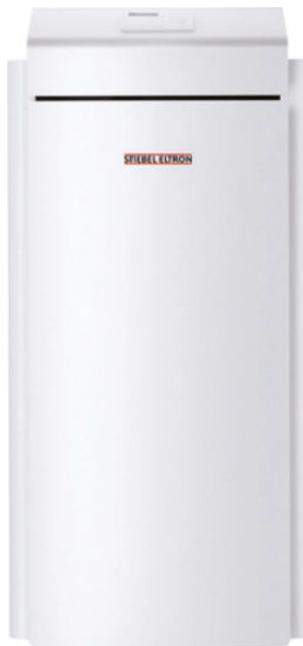
WPW 6-22 Set

Die WPW-I H-Premium-Baureihe wurde speziell für die Belastungen durch das Grundwasser optimiert. Die Wärmepumpe bietet sehr guten Warmwasserkomfort durch hohe Vorlauftemperatur von bis zu 65°C.