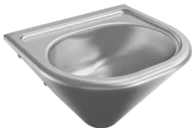
ANIMA Waschtisch ANMX450