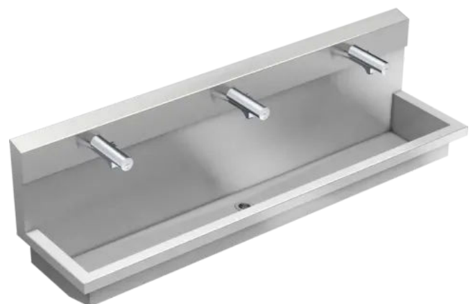
Produktbeispiel: KWC PLANOX Waschplatzeinheit mit Elektronik-Waschplatzbatterien, 3 Waschplätze, 1800 mm breit.