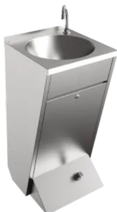
ANIMA Waschtisch mit fußbetätigter Selbstschlussarmatur LP21