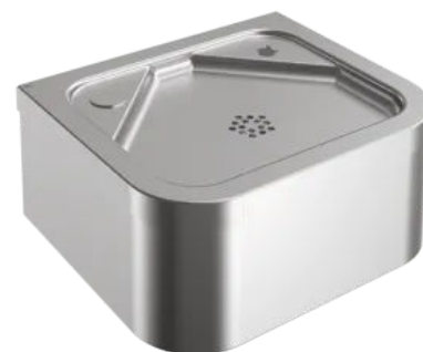
ANIMA Trinkbrunnen ANMX21ES