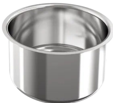
RONDO Einbaubecken BR3000U