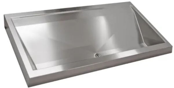
Produktbeispiel: KWC PRESTIGE Reihenwaschanlage einreihig für Montage an der Wand.

Die PRESTIGE Reihenwaschanlage ist für die einreihige Wandmontage oder doppelreihige Aufstellung im Raum konzipiert und besteht aus Chromnickelstahl mit seidenmatter Oberfläche und einer Materialstärke von 1,2 mm. Wahlweise sind Becken mit 2 oder 3 Waschplätzen mit einer Waschplatzbreite von 600, 700 oder 800 mm möglich.