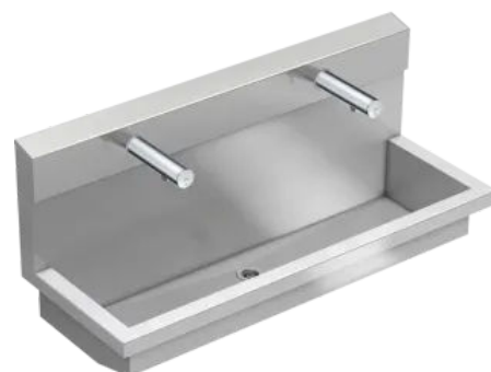
PLANOX Waschplatzeinheit mit Elektronik-Wandventilen