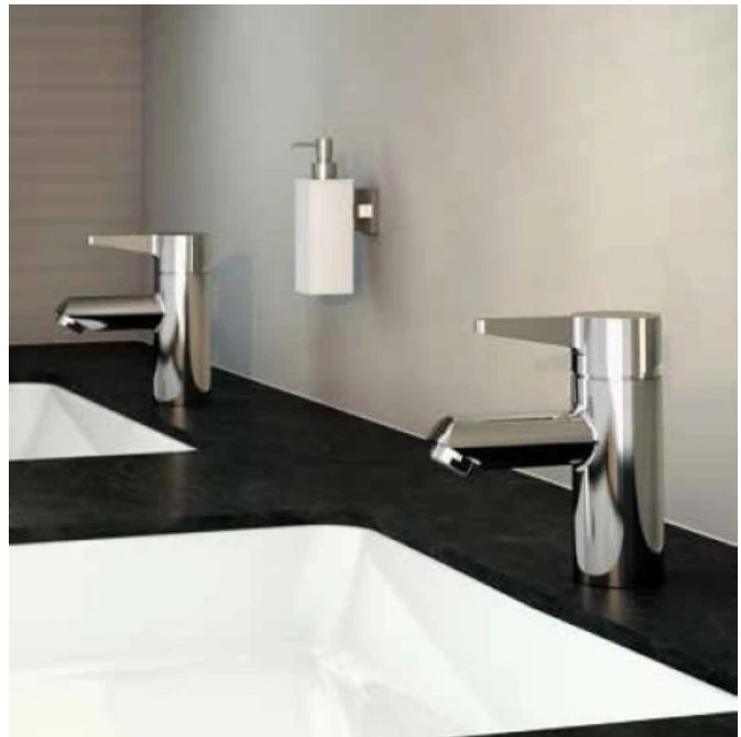
Anwendungsbeispiel Einhebel-Mischer MODUS EH

Die Kaltwasser-Armatur MODUS K ist sehr kompakt und wird gerne dort eingesetzt, wo nur wenig Platz zur Verfügung steht. Die Bedienung der MODUS K ist besonders leichtgängig.