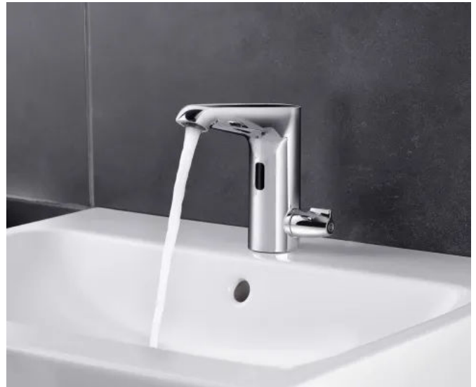
Anwendungsbeispiel Elektronische Waschtisch-Armatur XERIS E mit Temperaturregler

Die elektronische Waschtisch-Armatur PURIS E erfüllt höchste Anforderungen an Hygiene und Wirtschaftlichkeit. Das Elektronikmodul verfügt über 5 wählbare Spülprogramme inkl. Stagnationsspülung, thermische Desinfektion und Reinigungsstopp. Auf niedrigere Batteriespannung wird über eine LED-Anzeige hingewiesen. Der Netzanschluss kann wahlweise über ein Unterputz- bzw. Steckernetzteil erfolgen. Für das besondere Design wurde PURIS E mit dem Design Plus Award ausgezeichnet.