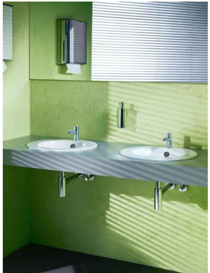
Anwendungsbeispiel Selbstschluss-Standventil PETIT SC

Das Standventil PETIT SC für kaltes und vorgemischtes Wasser ist ein robustes Selbstschluss-Standventil für den Einsatz im öffentlichen und gewerblichen Bereich. Eine optional erhältliche Verdrehsicherung ermöglicht zusätzlichen Schutz vor Vandalismus. Für den sparsamen Wasserverbrauch sorgt die Durchflussmenge von nur 6,0 l/min, sowie eine stufenlose Laufzeiteinstellung der Armatur.