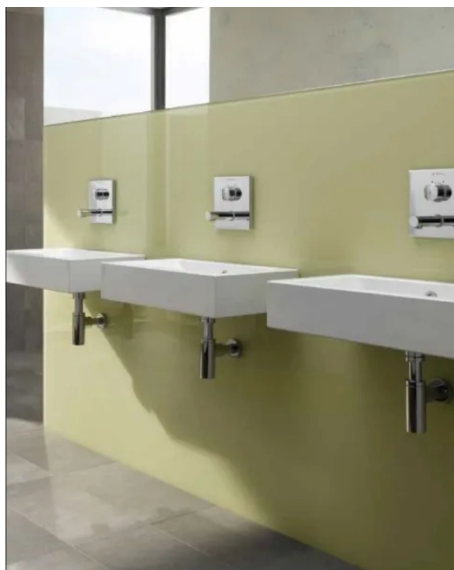
Anwendungsbeispiel Wandeinbau-Wandauslaufarmaturen LINUS W-SC

Als Alternative zum erfolgreichen Selbstschluss-Standventil PETIT SC gibt es die Armatur auch als Wandauslauf-Variante. Die äußerst robuste Armatur für kaltes oder vorgemischtes Wasser und ihre sparsame Durchflussmenge von nur 5 l/min eignet sich besonders für öffentliche bzw. gewerbliche Reihenwaschplätze.