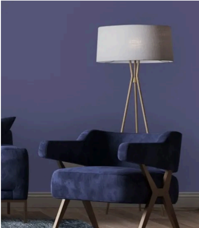
Wandfarbe Puro DD125788

Aus der Serie Vinyltapeten und Fototapeten für den Objektbereich von Architects Paper® a brand of A.S. Création Tapeten