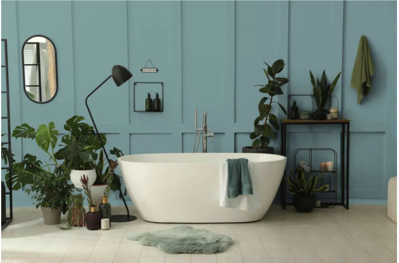
Wandfarbe Puro DD125905 | ©Architects Paper