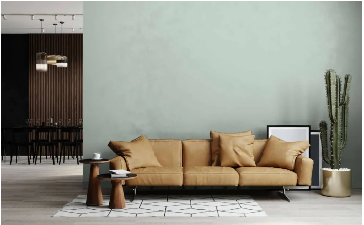
Wandfarbe Puro DD125920 | ©Architects Paper

Aus der Serie Vinyltapeten und Fototapeten für den Objektbereich von Architects Paper® a brand of A.S. Création Tapeten