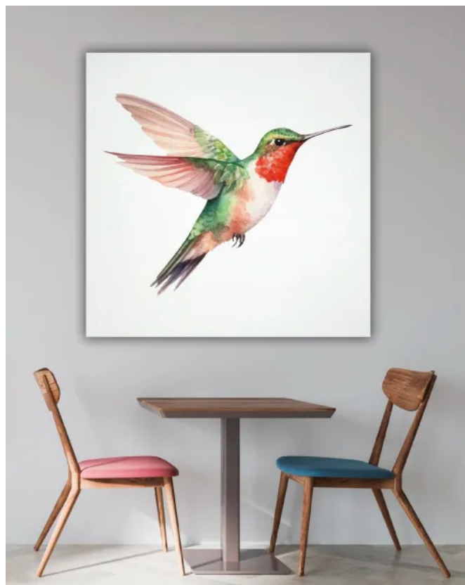
Creaprint Wandabsorber werden mit individuellen Wunschknoten und Ideen bedruckt.