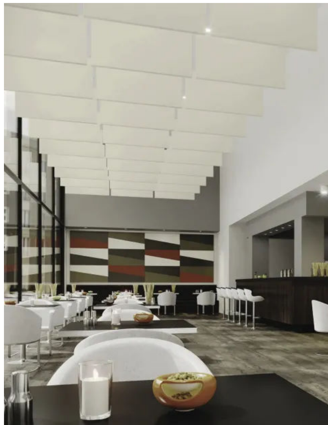
FreeStyle Wandabsorber verleihen jeder Wandoberfläche eine 3D-Optik.