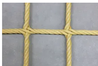
Typ B Netzknoten für vertikale Netze