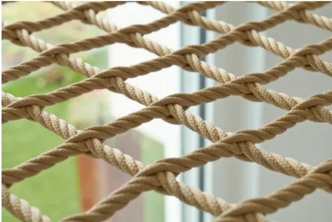
Beispiel für Walknet Netzknoten in Freiform

Aus der Serie Architekturlösungen mit Netzen – Webnet und Walknet von Jakob Rope Systems