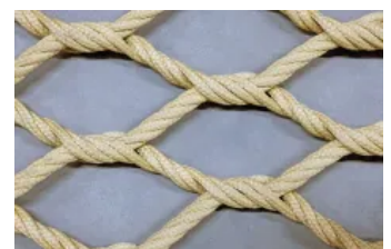
Freiform Typ D