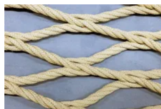
Freiform Typ C