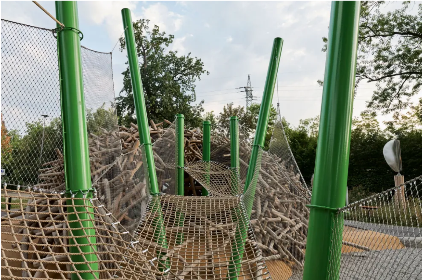
Begehbare Walknet Netzflächen im Außenbereich für kreative Gestaltung von Spiel- und Kletterflächen

Aus der Serie Architekturlösungen mit Netzen – Webnet und Walknet von Jakob Rope Systems