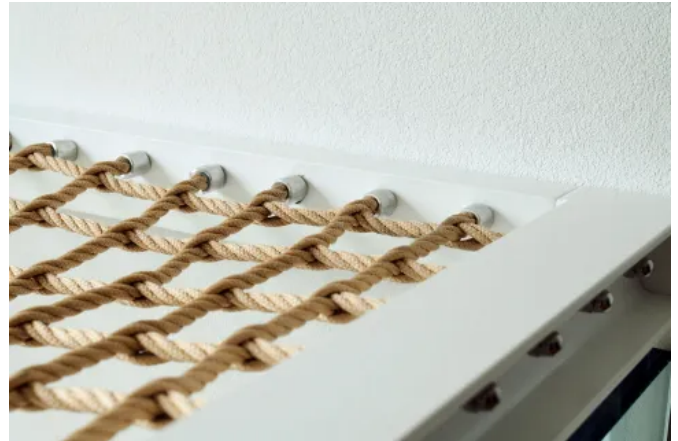
Walknet Randanbindung mit Rahmen