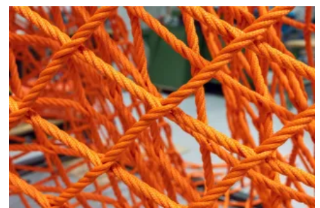
Walknet Details lassen sich flexibel gestalten: von Seildurchmessern über Maschengometrien und Netzknoten bis hin zu Randanschlüssen und freier Formgebung.