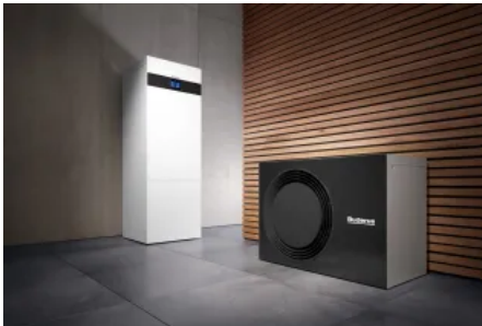
Komfort-Hydraulik-Inneneinheit Logatherm WLW176i AR T180 und Außeneinheit der Logatherm WLW176i AR