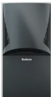
Logatherm WLW286 A

Mehr Informationen: Broschüre Logatherm WLW196i IR