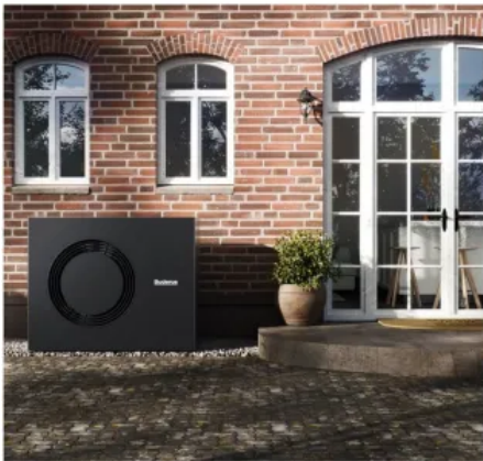
Wärmepumpen-Außeneinheit Buderus Logatherm WLW MB AR im Titan-Design

Mehr Informationen: Broschüre Logatherm WLW176i AR