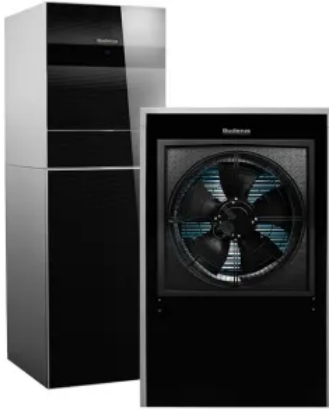
Logatherm WLW 196i IR

Aus der Serie Wärmepumpentechnik von Buderus