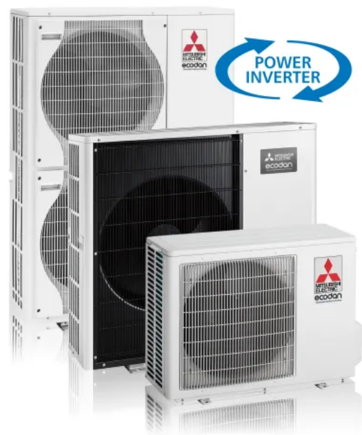
Ecodan Luft/Wasser Wärmepumpe, Außengerät mit Power Inverter

Power Inverter lassen sich sehr gut in bivalente Systeme integrieren. Die Kombination mit einem zweiten Wärmeerzeuger wird über den integrierten Wärmepumpenmanager unter verschiedenen Gesichtspunkten (Kosten, CO 2 -Einsparung, etc.) optimiert.