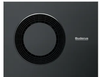
Buderus Wärmepumpe: Inneneinheit Logatherm WLW186i T180, Außeneinheit Logatherm WLW-10/-12 MB AR