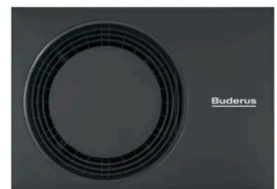
Buderus Wärmepumpe: Inneneinheit Logatherm WLW176i T180, Außeneinheit Logatherm WLW-4/-5/-7 MB AR