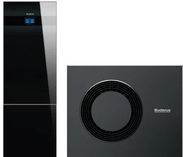
Buderus Wärmepumpe: Inneneinheit Logatherm WLW186i T180, Außeneinheit Logatherm WLW-10/-12 MB AR

Mehr Informationen zur Wärmepumpe Logatherm WLW186i AR