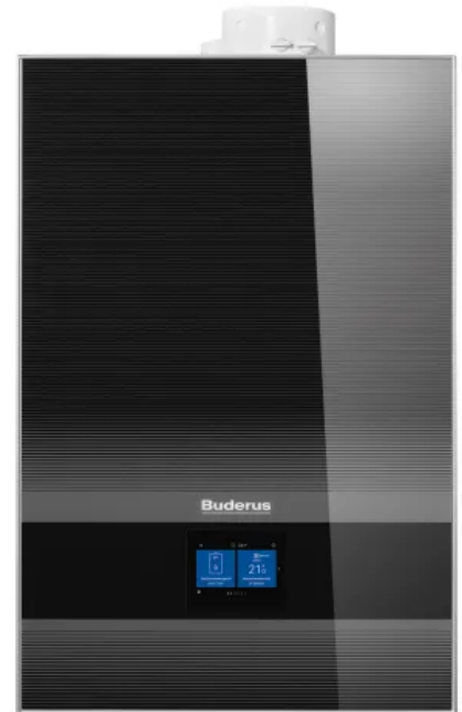
Buderus Brennwertgerät: Logamax plus GB192i.2

Mehr Informationen zum Gas-Brennwertgerät Logamax plus GB192i