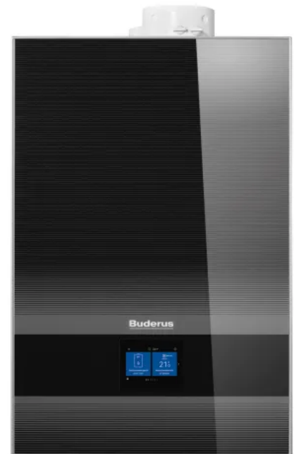
Buderus Brennwertgerät: Logamax plus GB192i.2

Mehr Informationen zum Gas-Brennwertgerät Logamax plus GB192i