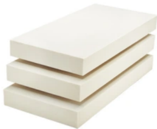
PUR Smart 3882

Im Systemaufbau geprüfte Polyurethan-Hartschaum Dämmplatten für den Einsatz im Brillux WDV-System PUR Smart. Für die außenseitige Dämmung von Fassaden.