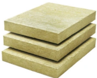
MW Top Laibungsplatte 3522

Im Systemaufbau geprüfte Dämmplatte für den Einsatz im Brillux WDV-System MW Top und MW Ecotop.