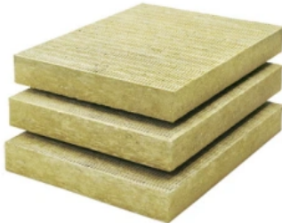
MW Top Dämmplatte 3586

Im Systemaufbau geprüfte Dämmplatte für den Einsatz im Brillux WDV-System MW Top u. MW Ecotop.