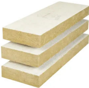
MW Top Dämmplatte LD DLF 3891

Weitere Informationen im Praxismerkblatt 3891