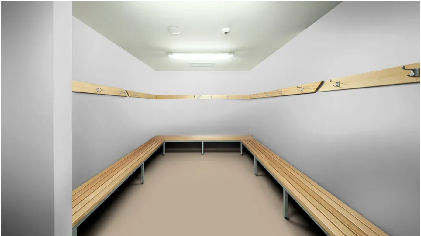
Gerflor Tarasafe H20, heterogener Bodenbelag für Nassbereiche mit erhöhter Trittsicherheit