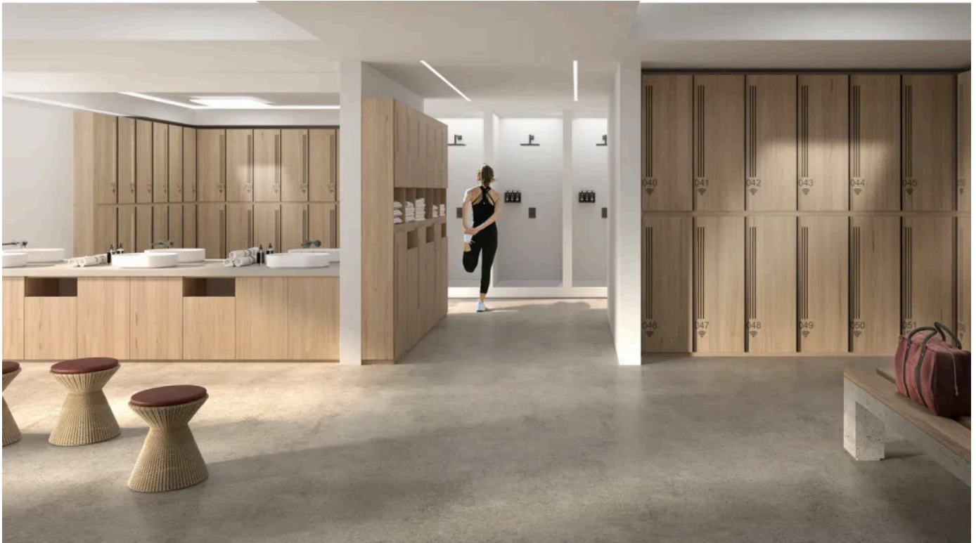
Gerflor Tarasafe Design, heterogener und dekorativer, rutschhemmender Bodenbelag für eine trittsichere wohnliche Umgebung

Heterogener und dekorativer, rutschhemmender Bodenbelag für eine trittsichere wohnliche Umgebung.