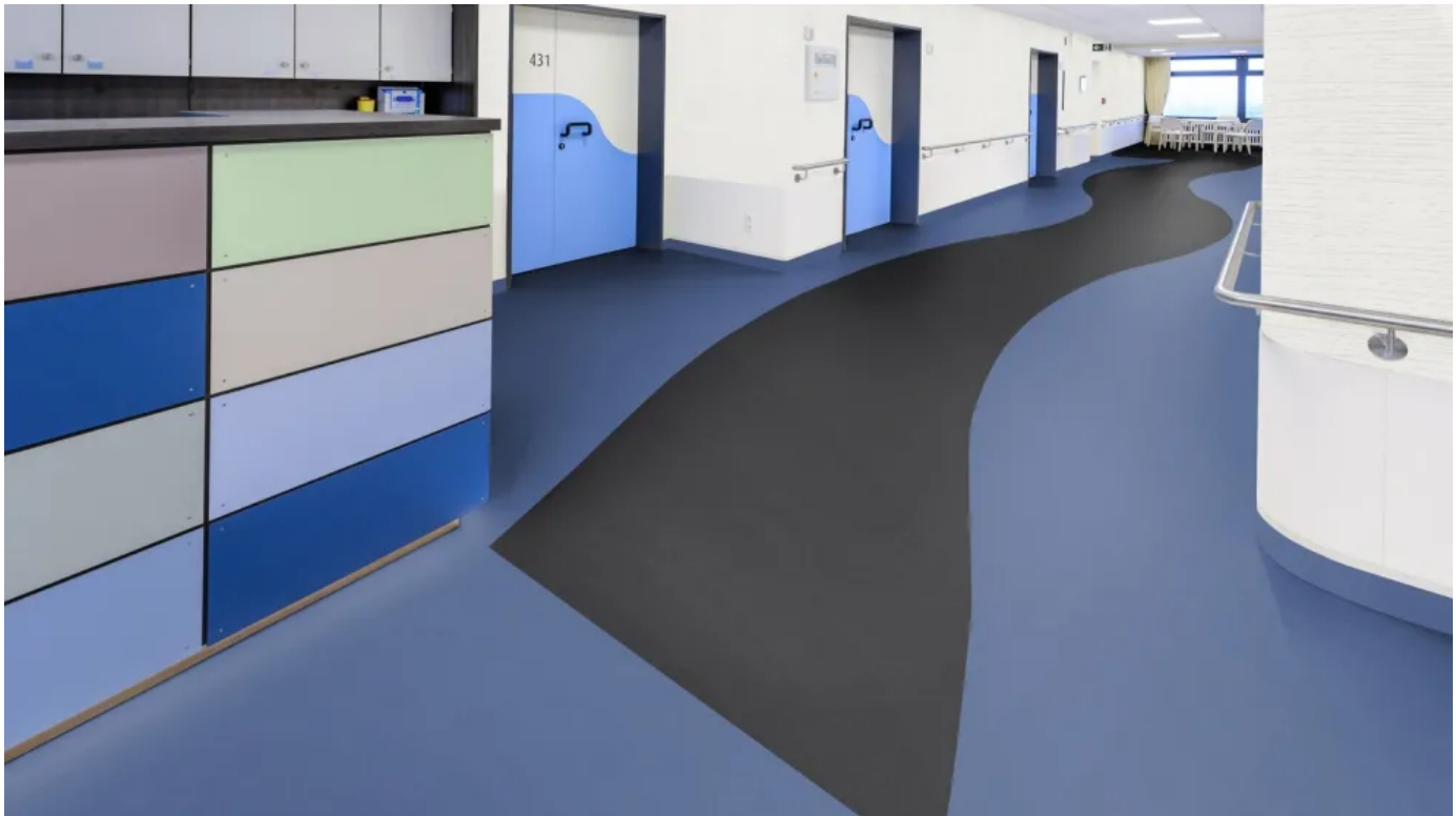
Tarasafe Standard, heterogener Bodenbelag mit hoher Rutsicherheit in Kombination mit der Sparclean®-Oberflächenbehandlung

Heterogener Bodenbelag mit hoher Rutsicherheit in Kombination mit der Sparclean®-Oberflächenbehandlung