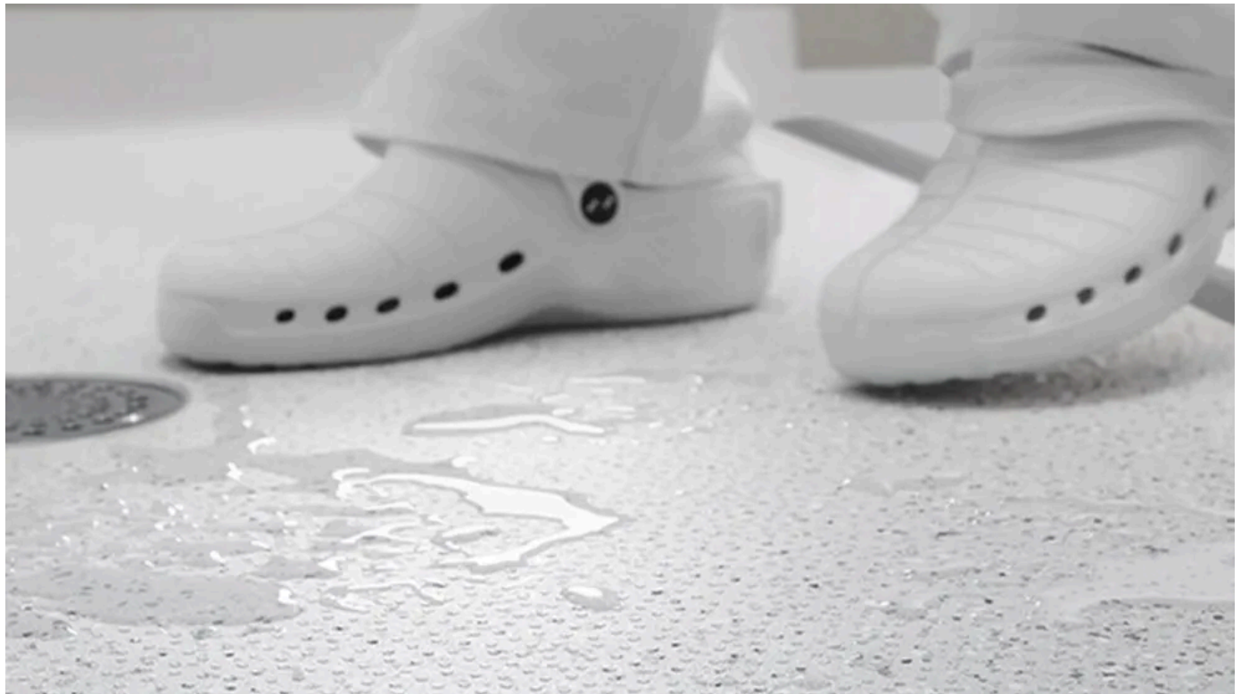
Tarasafe Ultra H2O, heterogener Sicherheitsbodenbelag mit Noppenstruktur für Nass- und Duschbereiche

Heterogener Sicherheitsbodenbelag mit Noppenstruktur für Nass- und Duschbereiche