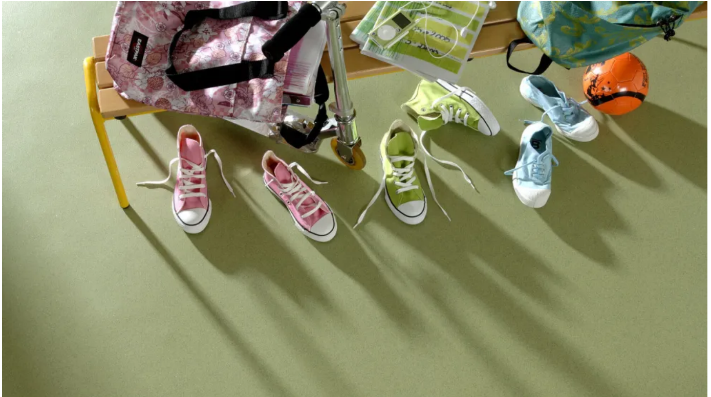
Tarasafe Ultra, heterogener Bodenbelag mit hoher Rutsicherheit und hoher Abriebfestigkeit in Kombination mit der Sparclean®-Oberflächenbehandlung

Heterogener Bodenbelag mit hoher Rutsicherheit und hoher Abriebfestigkeit in Kombination mit der Sparclean®-Oberflächenbehandlung