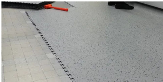
Homogene Bodenbeläge GTI EL5 CONNECT

Evercare™ Oberflächenvergütung Fliesen, 635 x 635 mm, Schwalbenschwanzprofil Elektrischer Widerstand gem. DIN 1081: 5 \times 10^4 \leq R_t \leq 10^6 \Omega 5 Farben farbgleich zu GTI Connect