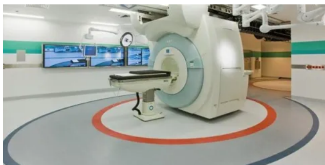
Homogene Bodenbeläge MIPOLAM ELEGANCE EL5

Besonders für den Einsatz in Operationsräumen geeignet.