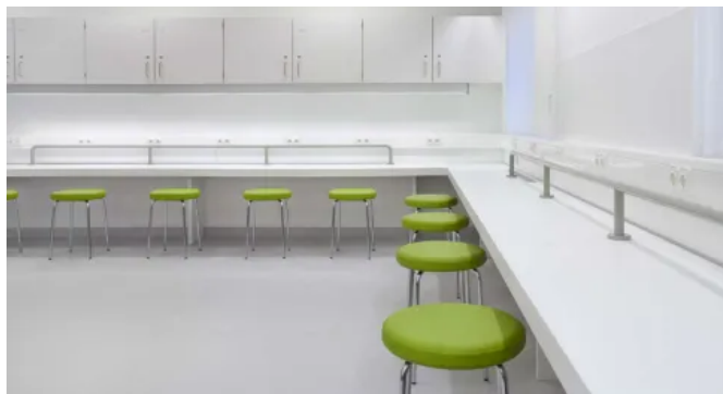
Homogene Bodenbeläge MIPOLAM AFFINITY EL7