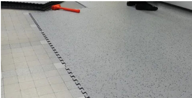
Homogene Bodenbeläge GTI EL5 CONNECT

Evercare™ Oberflächenvergütung Fliesen, 635 x 635 mm, Schwalbenschwanzprofil Elektrischer Widerstand gem. DIN 1081: 5 \times 10^4 \leq R_t \leq 10^6 \Omega 5 Farben farbgleich zu GTI Connect