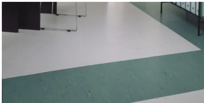
Homogene Bodenbeläge MIPOLAM ROBUST EL7