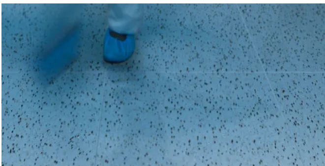
Homogene Bodenbeläge GTI EL5 CLEANTECH

Besonders für den Einsatz in Krankenhäusern und Kliniken geeignet. Evercare™ Oberflächenvergütung Fliesen, 650 x 650 mm Wasserdichtes System bei thermischer Verschweißung Elektrischer Widerstand gem. DIN 1081: 5 \times 10^4 \leq R_t \leq 10^6 \Omega 5 Farben farbgleich zu GTI Cleantech