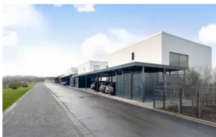
Reihencarport mit Geräteraum