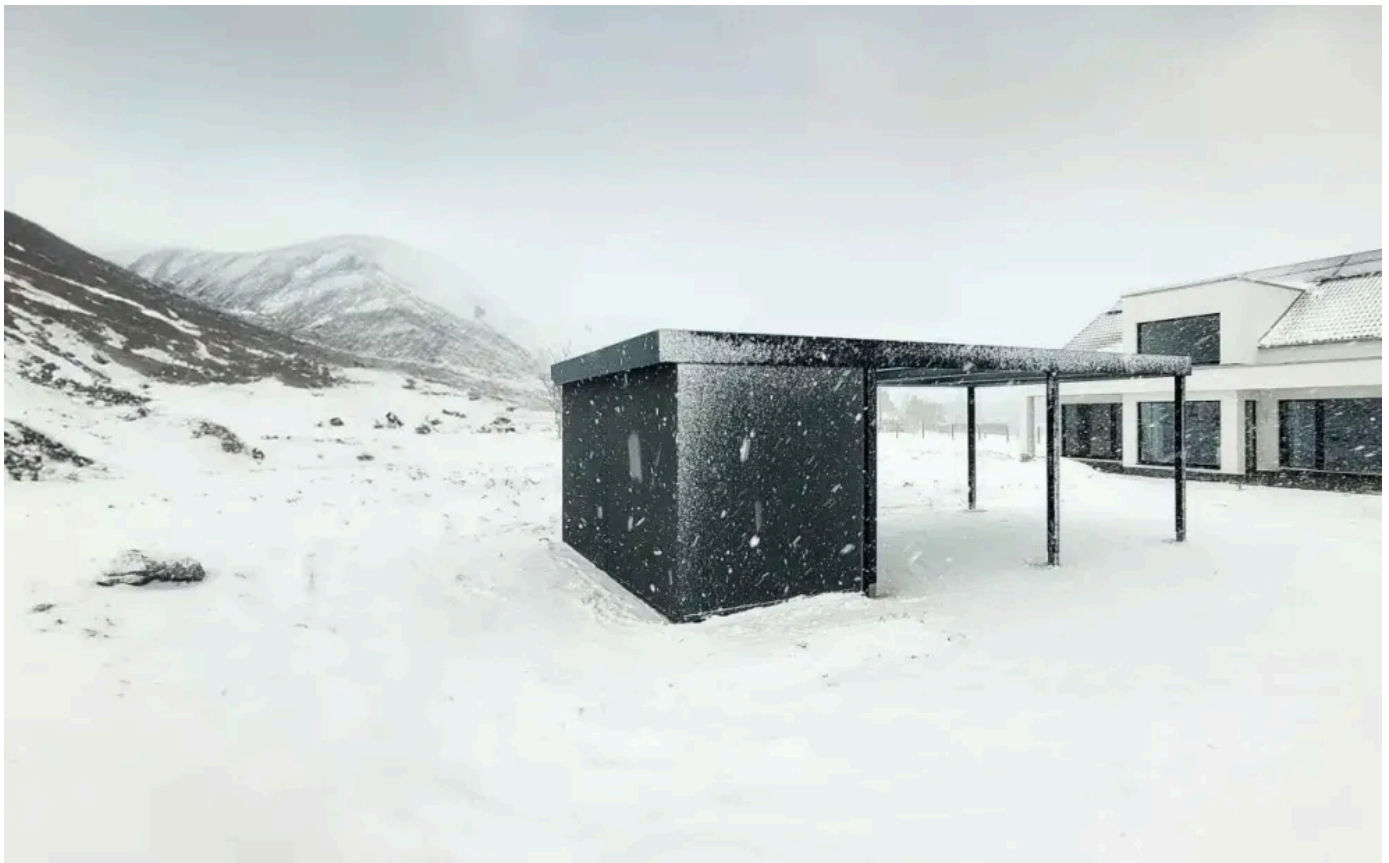
Einzelcarport und Geräteraum mit Stahlwänden