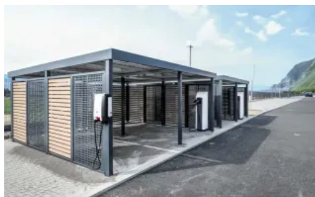
Reihencarport mit Ladestationen