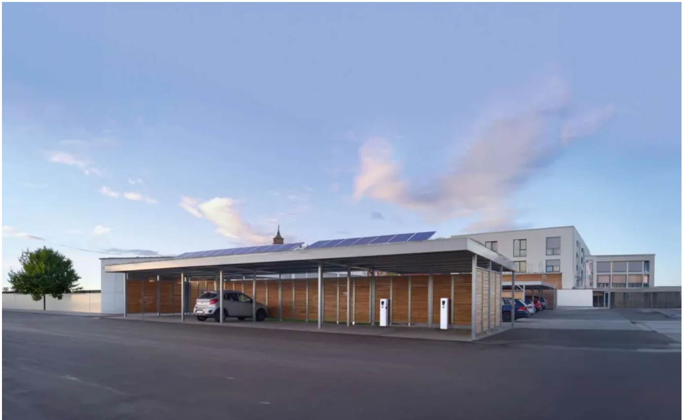
Reihencarport mit Sichtschutzelementen aus Holz und Wallboxen zum Laden von E-Autos

SIEBAU Carports sind zahlreich konfigurierbar und auch nachträglich nahezu beliebig erweiterbar. So können zum Beispiel auch nach Jahren noch ein Anbaucarport angesetzt, Wandfelder hinzugenommen oder Geräteräume eingebaut werden.