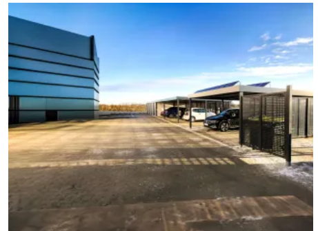
Reihencarport mit Photovoltaik auf dem Dach und Sichtschutzelementen aus Stahl mit Quadratlochung

Für die Nutzung des erzeugten Stroms zum Laden von Elektrofahrzeugen bietet SIEBAU passende Wandelemente (E-Panels) zur Montage einer Wallbox an.