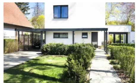
Carport mit Eingangsüberdachung