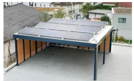
Carport mit Photovoltaik