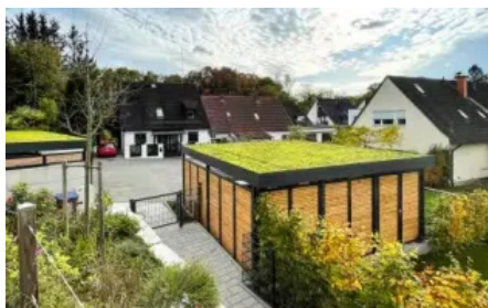
Carport mit Dachbegrünung