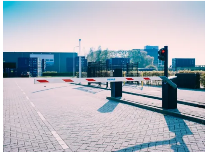
Schranke Heras Traffic Barrier (HTB)