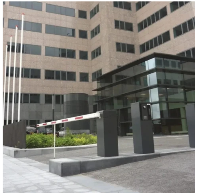
Schranke Heras Traffic Barrier (HTB)