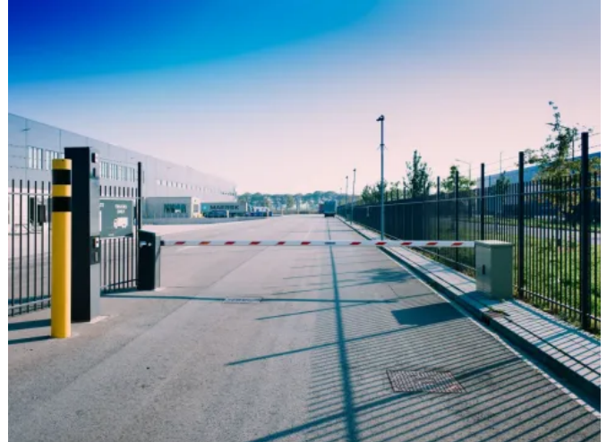
Schranke Heras Traffic Barrier (HTB)