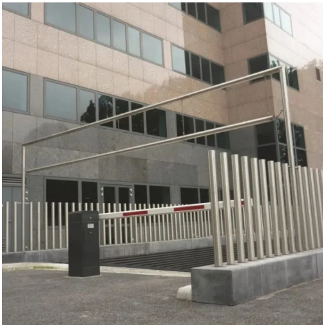
Schranke Heras Traffic Barrier (HTB)