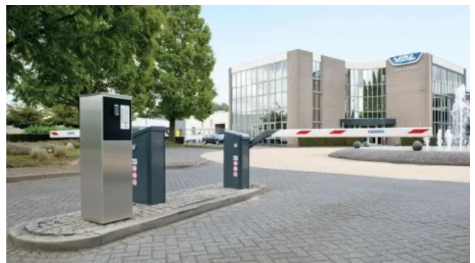
Schranke Heras Traffic Barrier (HTB)

HTB Schranken können optional mit LED-Beleuchtung, elektromechanischer Schrankenbaumverriegelung und (je nach Schrankenbaumlänge) festem Auflagepfosten oder Pendelstütze ausgestattet werden.