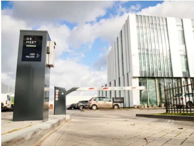
Schranke Heras Traffic Barrier (HTB)

Aus der Serie Zugangskontrolle mit Toren, Drehkreuzen und Schranken von Heras