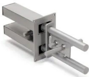
Doppelschubdorn JSD / JSDQ