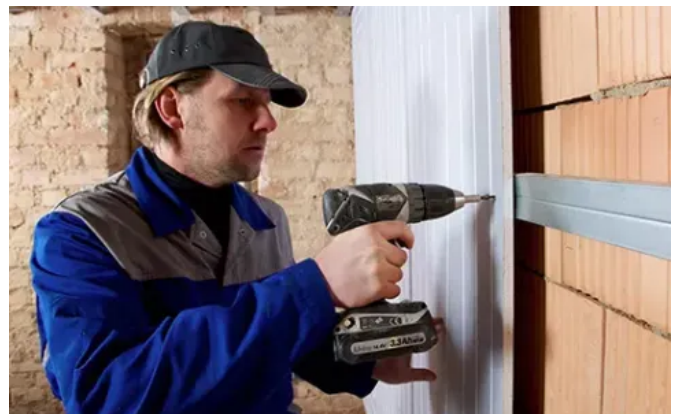
Uponor Renovis Trockenbausystem