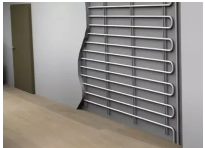
Uponor Siccus SW Ständerwandssystem