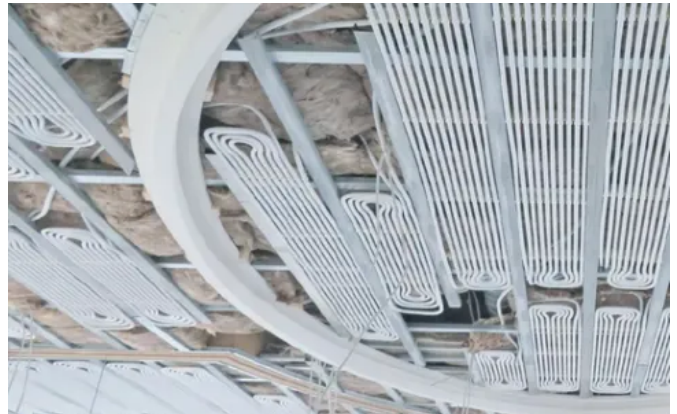
Uponor Thermatop M

Speziell geformte Befestigungsschienen sorgen für einen sehr guten Kontakt der Rohre mit der Gipskarton-Thermoplatte und ermöglichen so hohe Leistungswerte des Deckenkühlung. In Verbindung mit der einfachen Planung und Auslegung lassen sich architektonisch ansprechende, fugen- und richtungslose Heiz- und Kühldecken in einem breiten Objektspektrum vom Einfamilienhaus bis hin zu großen Gewerbebauten umsetzen.