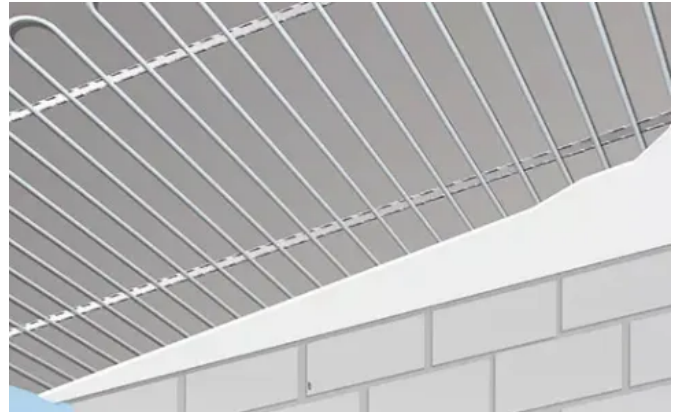
Uponor Fix 9,9