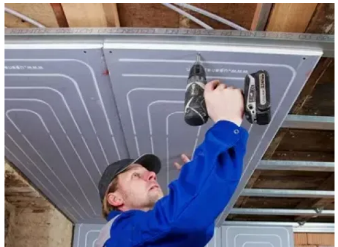
Uponor Renovis Trockenbausystem

Renovis ermöglicht es, auch Einzelräume mit einer Flächenheizung zu temperieren und in ein bestehendes Hochtemperatursystem mit Radiatoren zu integrieren. Damit ist eine individuelle Anpassung an die Nutzungsanforderungen möglich, ohne dass die Heizungsanlage komplett ausgetauscht werden muss. Dies reduziert Kosten und schafft gleichzeitig gestalterische Freiheiten bei der Sanierung von Einzelräumen. Der Anschluss über einen einfachen Tichelmann-Verteiler reduziert für den Fachhandwerker zudem den Aufwand bei der Auslegung der Heizkreise, der Regelung und der Installation. Renovis kann gleichermaßen zum Heizen als auch zum Kühlen eingesetzt werden.