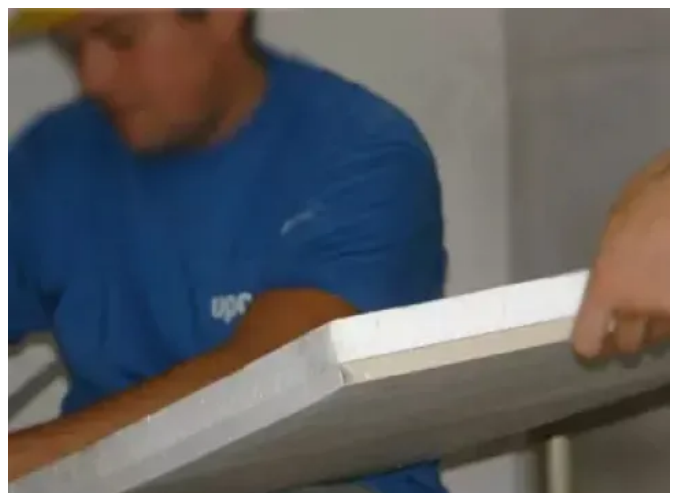
Uponor Teporis Trockenbausystem

Die Systemplatten bestehen aus einer 15 mm starken, faserverstärkten Gipsplatte mit einer EPS-Dämmschicht. Sie werden direkt auf die Unterkonstruktion geschraubt. Entsprechend der definierten Heiz- oder Kühlleistung können Flächen von 15 bis 25 m 2 an einem Heizkreis der Dimension 20 mm im Tichelmannsystem angeschlossen und mit Heiz- oder Kälteflüssigkeiten versorgt werden.