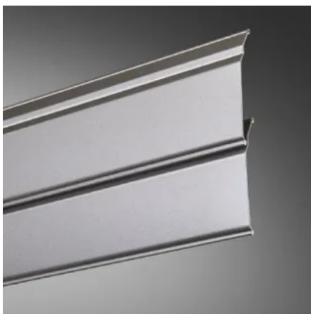
Comfort & Design Lamelle CDL