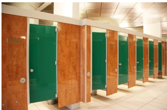
SANA Umkleide- und Wechselkabinen

Einsatzbereiche: Hallenbäder, Sportanlagen, Massagepraxen, Krankenhäuser, öffentliche Einrichtungen