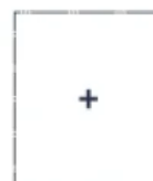
Weitere Farben, Holzdekore und Digitaldruck auf Anfrage.