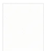
0085 FH Weiss