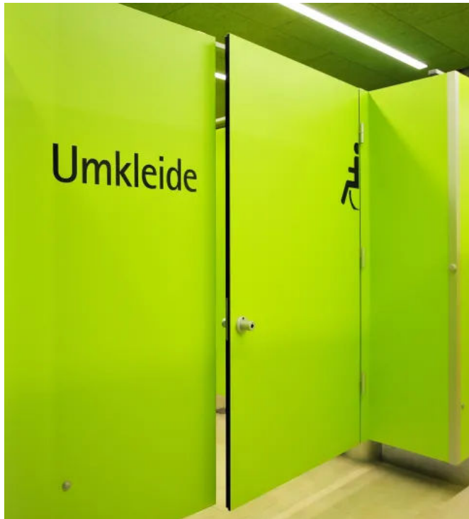
SANA Umkleidekabine - rollstuhlgerechte Ausführung

Aus der Serie Umkleidekabinen und Wechselkabinen von SANA Trennwandbau