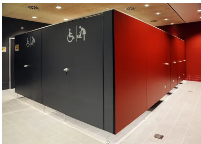
SANA Umkleidekabine - barrierefreie Ausführungen

Auch für die Ansprüche an die Barrierefreiheit in öffentlichen Einrichtungen, Bädern, Schulen und Betrieben bietet SANA unterschiedliche und individuelle Lösungen. Diese werden in enger Zusammenarbeit mit Planern und Bauherren verwirklicht.