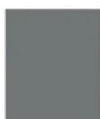
0075 FH Dunkelgrau