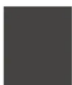
0077 FH Graphitgrau