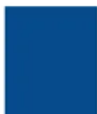
0237 FH Enzianblau