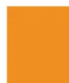
0011 FH Mandarin