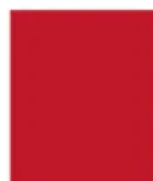
0067 FH Rot