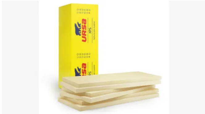
URSA XPS N-III-L