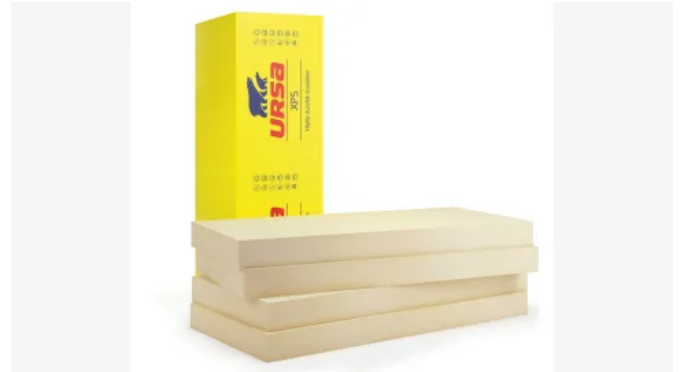
URSA XPS N-III-L-TWINS

Umkehrdächer lassen sich in unterschiedlichen Varianten im Neubau und der Sanierung ausführen.