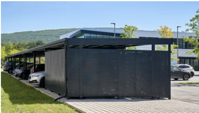
Carport in Füllungsvariante Quadratlochblech (© Maximilian Bauer)