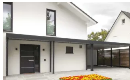
Vordach Serie CP mit Anbindung an den Carport mit Sichtschutzelement aus Holz