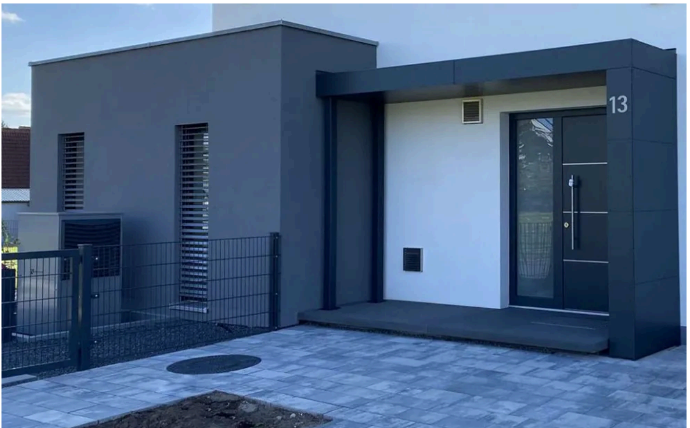
Vordach in L-Form mit 2 Stützen und Hausnummer