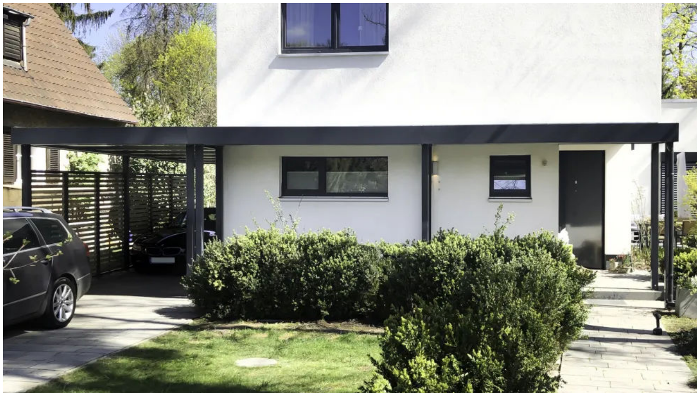
Vordach CP als weiterführende Eingangüberdachung zum Carport

Die Vordächer der Serie CP von Siebau stellen eine stabile Lösung für geschützte Eingangsbereiche dar – sowohl im privaten als auch im gewerblichen Umfeld. Sie basieren auf dem modularen Systembaukasten der Siebau Carports und werden aus Stahl maßgefertigt. Eine Befestigung an der Fassade ist nicht erforderlich, was eine flexible Platzierung unabhängig von baulichen Gegebenheiten ermöglicht.