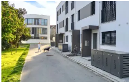
Vordach S.1 in L-Form ohne Stützen mit Briefkasten- und Klingelanlage