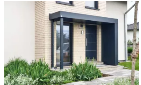
Vordach S.1 in L-Form mit 2 Stützen und Paneelen zwischen den Stützen in Glas