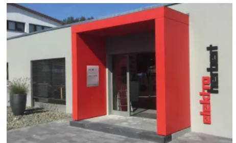
Vordach S.1 in U-Form , mit Briefkastenanlage