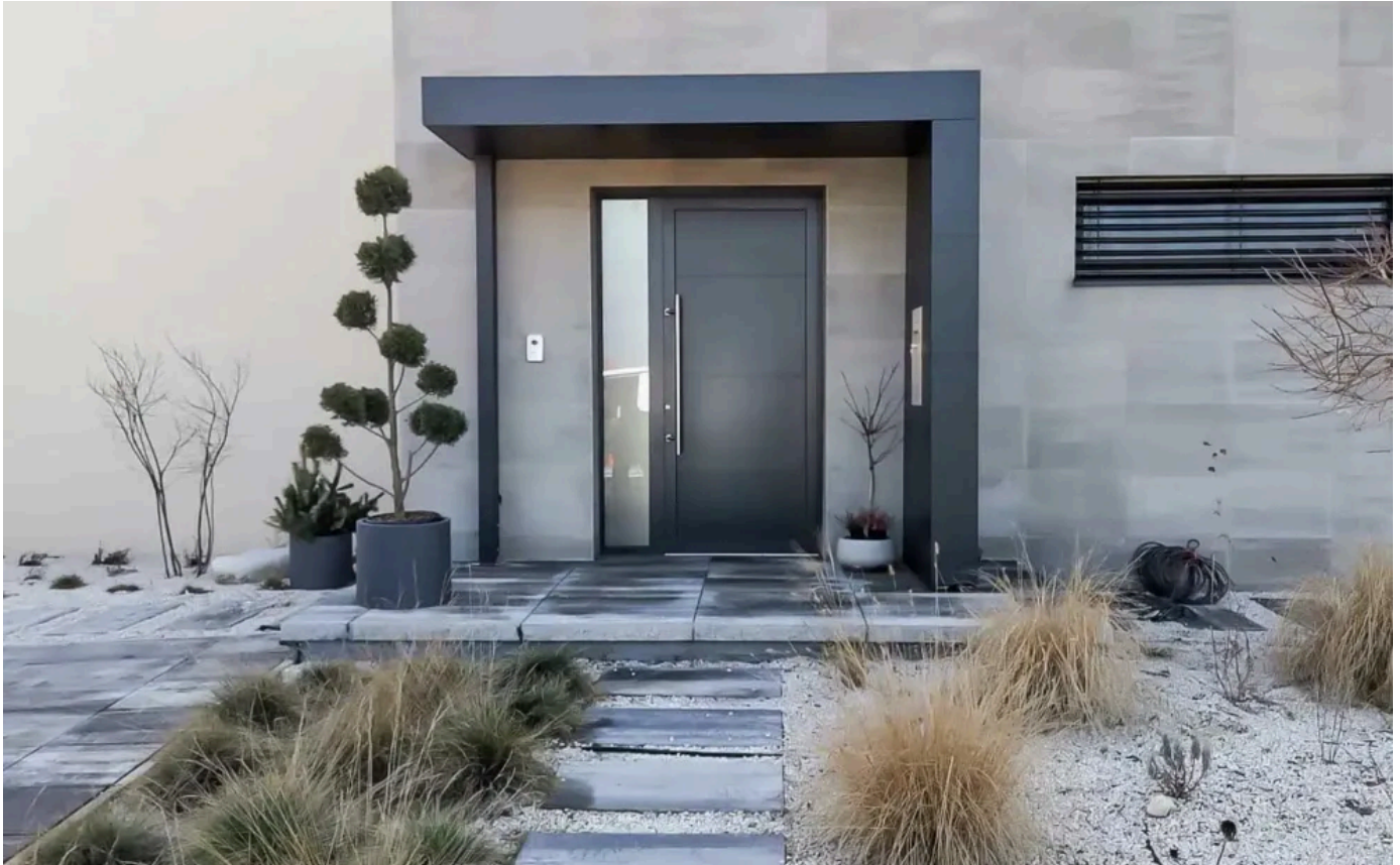
Vordach S.1 in L-Form mit einer Stütze, Briefkasten- und Klingelanlage