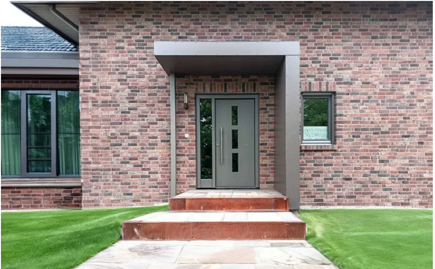
Vordach in L-Form mit einer Stütze