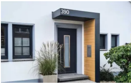
Vordach S.1 in L-Form ohne Stützen, mit Fassadenplatte in Holzdekor, mit Hausnummer