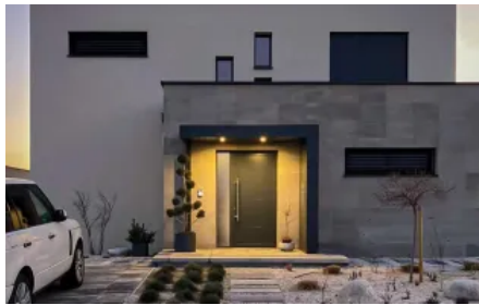
Vordach S.1 in L-Form mit einer Stütze, Briefkasten- und Klingelanlage