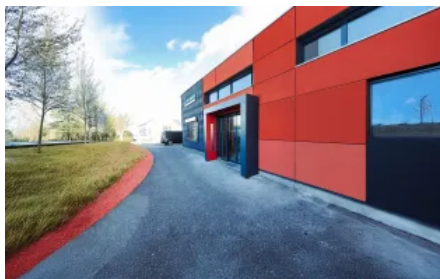
Vordach S.1 in U-Form , Verkleidungen außen anthrazit, innen rot