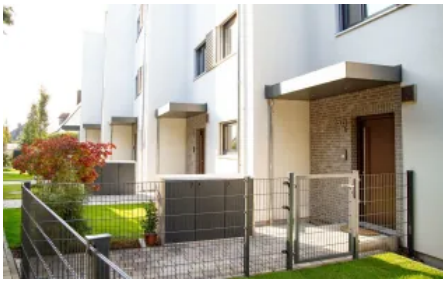
Vordach S.1, nur Dach , ohne Stützen, Regenfallrohr seitlich sichtbar