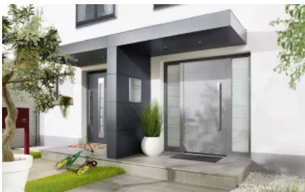
Vordach S.1 in T-Form ohne Stützen, mit Briefkastenanlage