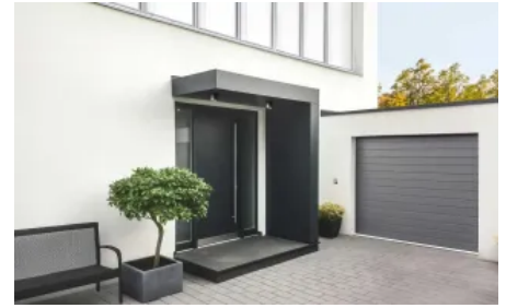
Vordach S.1 in L-Form ohne Stützen, mit Beleuchtung