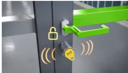
Nach Ende der Gefährdung können die gesicherten Gebäudebereiche mit Berechtigung von außen wieder geöffnet werden.