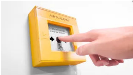
Nach der Alarmauslösung werden Gebäudebereiche sicher verschlossen.