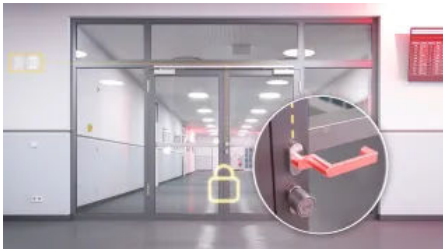
Die Türdrücker werden ausgekuppelt. Die Fluchtmöglichkeit von innen bleibt gewährleistet.