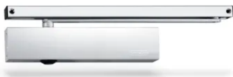
TS 5000 Gleitschienentürschließer – für einflügelige Türen bis 1400 mm Flügelbreite