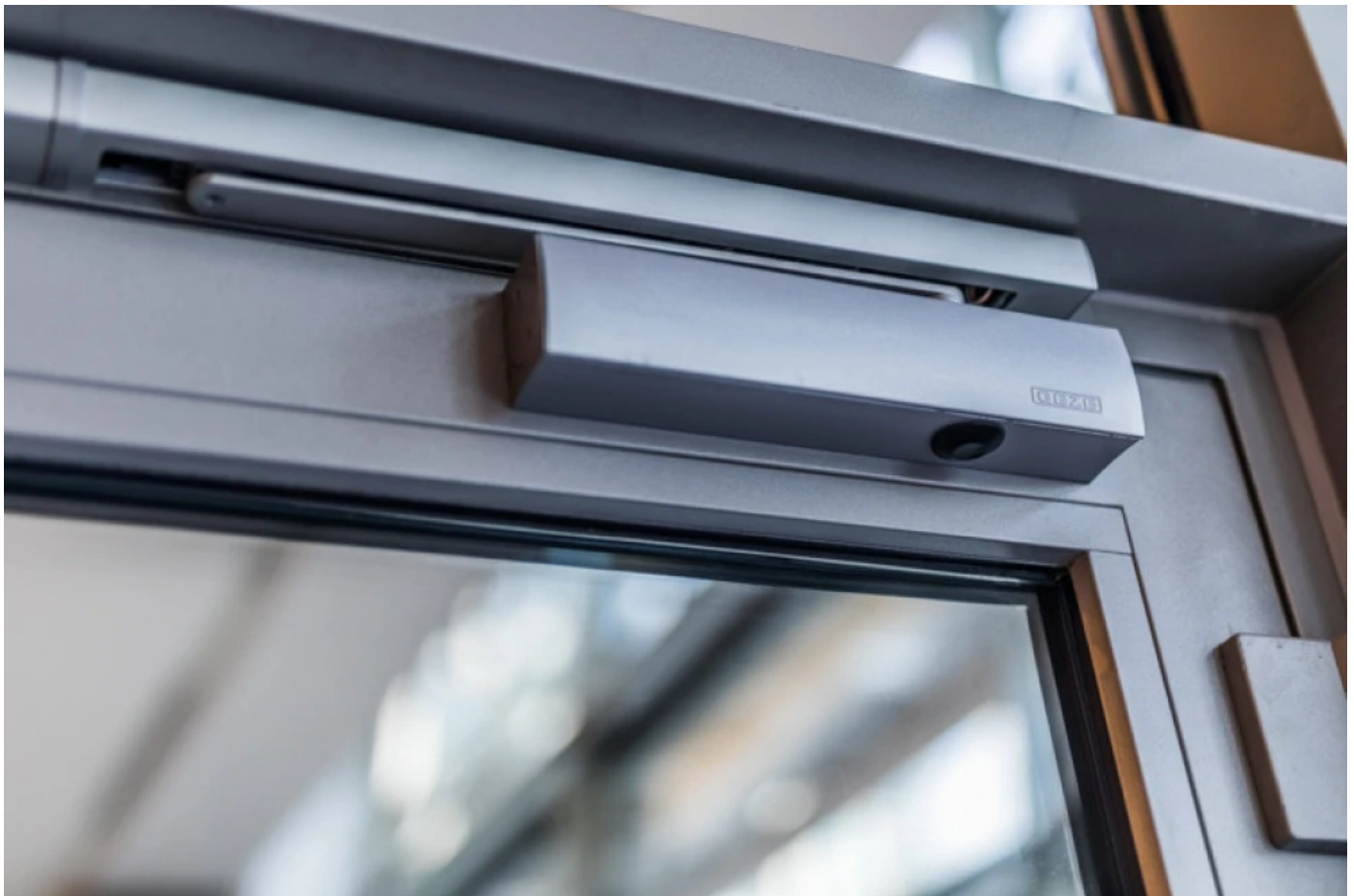
TS 5000 ECLINE Gleitschienentürschließer