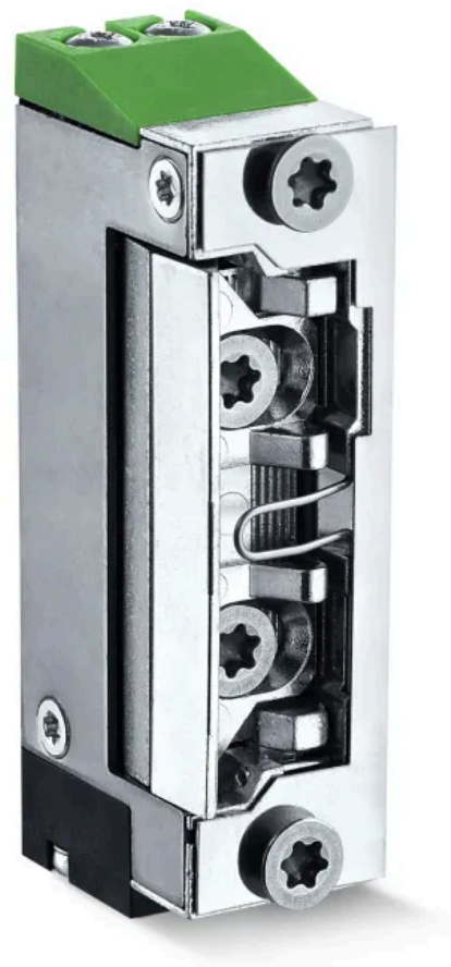
FT501--E – Feuerschutz-Türöffner