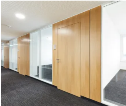
PANblind, keine Zarge sichtbar, flurseitig flächenbündig

Aus der Serie Türlösungen von PAN+ARMBRUSTER