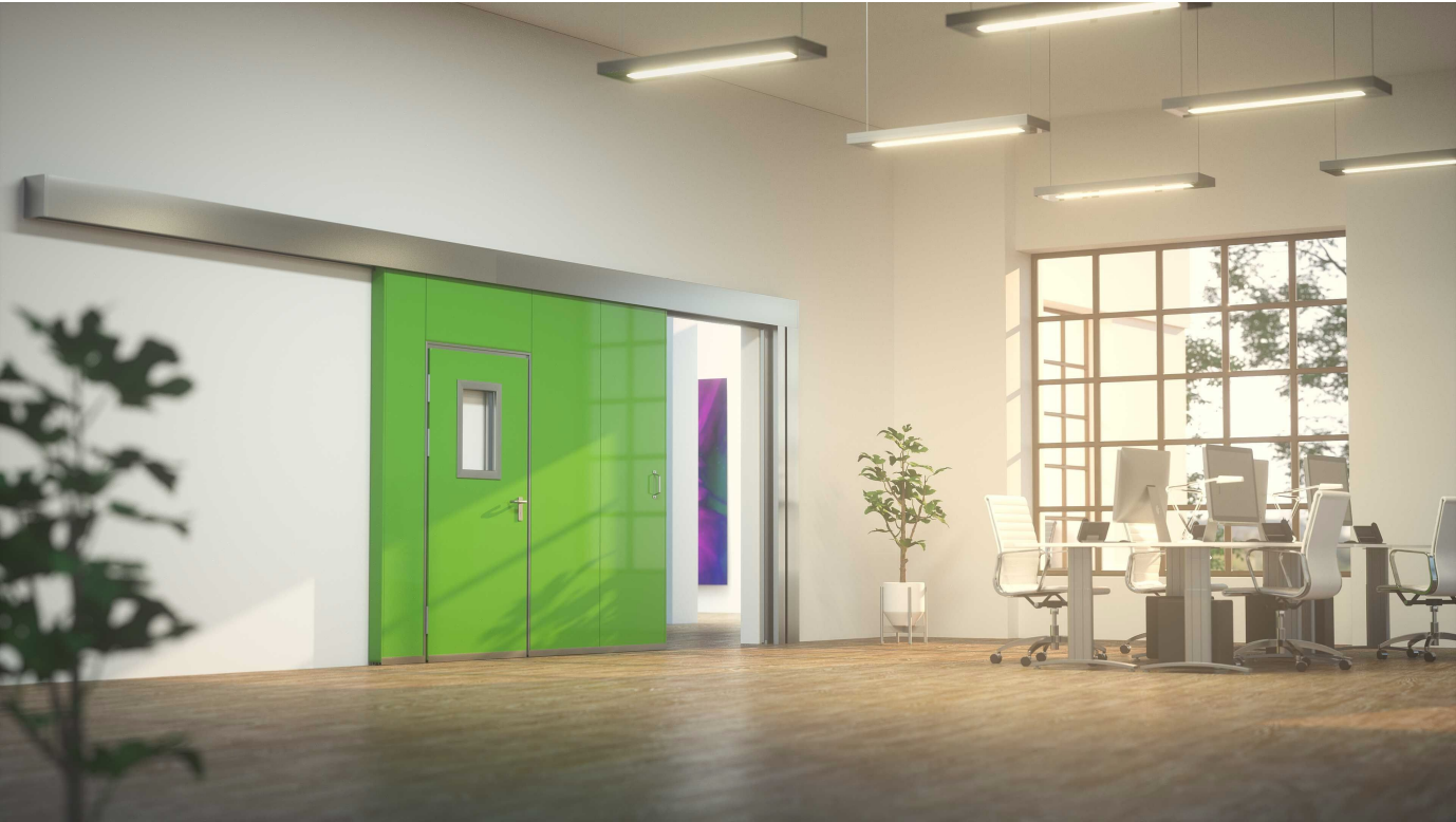
Mehrweckschiebetore in Abmessungen abhängig von der Leistungseigenschaft

Aus der Serie Türen und Tore mit Schiebeflügel von System Schröders Türen + Tore