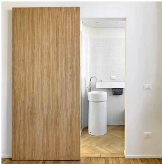
Verdeckte Beschläge H40-900 UND H80-900