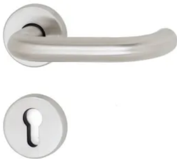
Türdrücker Rosettengarnitur A 302