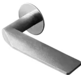
Randi-Line® Komé RAW C.F. Møller Architects