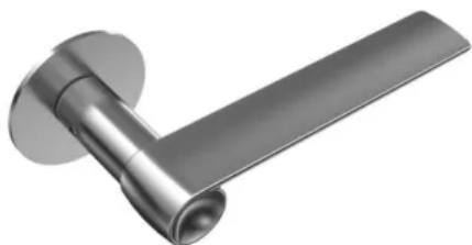
Randi-Line® Nordic Straight

Aus der Serie Türdrücker von Randi von ECO Schulte