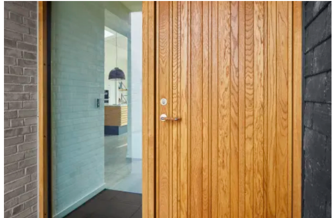
Randi-Line® Nordic Straight