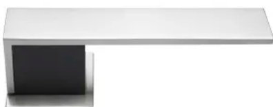
Randi-Line® Square Friis & Moltke Design