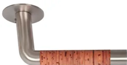
Randi-Line® Nordic Straight