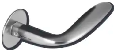
Randi-Line® Wing AART designers