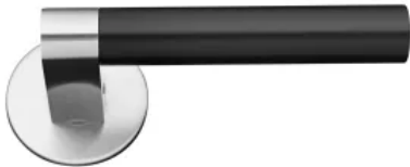
Randi-Line® Grata Friis & Moltke Design

Aus der Serie Türdrücker von Randi von ECO Schulte