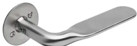
Randi-Line® Nordic Straight