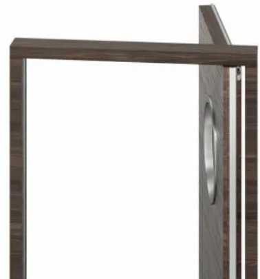
Rundumdicht Pivot L-15 Set für durchpendelnde Pivottüren