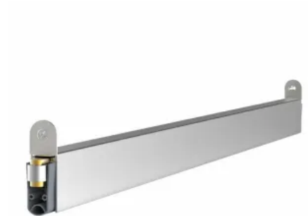
Schall-Ex® L-15/30 WS Pivot für ein- u. zweiflügelige durchpendelnde Pivottüren