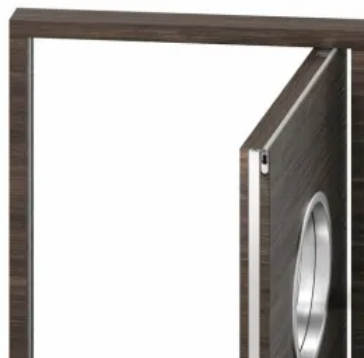
Rundumdicht Pivot L-15 Set für durchpendelnde Pivottüren