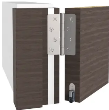
athmer Schall-Ex® L15: Absenkdichtung zum Einnuten mit optimaler Boden Anpassung für eine Schalldämmung bis 52 dB

Die automatische Türdichtung Schall-Ex® L15 ist eine Absenkdichtung zum Einnuten mit optimaler Boden Anpassung für ein- und zweiflügelige Türanlagen. Sie erzielt eine Schalldämmung von bis zu 52 dB.