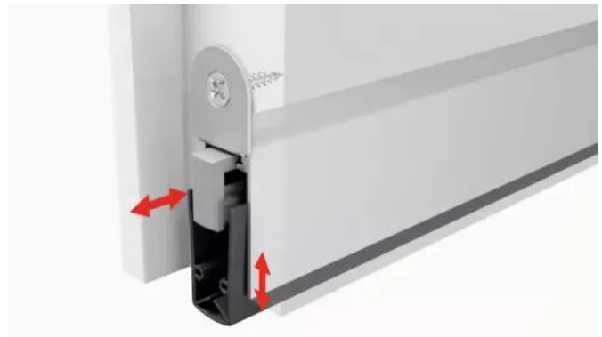
Die neue Athmer Dichtungsgeneration verfügt über einen einklipsbaren Gleitauflöser, der auch nachträglich einsetzbar ist.

Der Auflöser braucht erstmalig in Betrieb genommen werden, wenn der Bau bezugsfertig ist. Auf diese Weise ist gewährleistet, dass der Dreckschutt und Staub der Baustelle das Dichtungsprofil nicht vorab beschädigen oder in seiner Funktion beeinträchtigen.