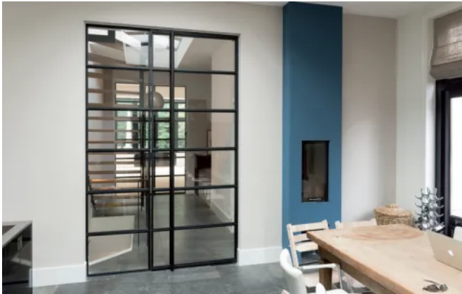
Privathaus in den Niederlanden

Aus der Serie Tür- und Trennwandsystem von Schüco Stahlssysteme Jansen von Schüco International Stahlssysteme