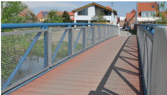
Sanierung der Elefantenbrücke in Bützow mit den bauaufsichtlich zugelassenen Profilen TRIMAX®