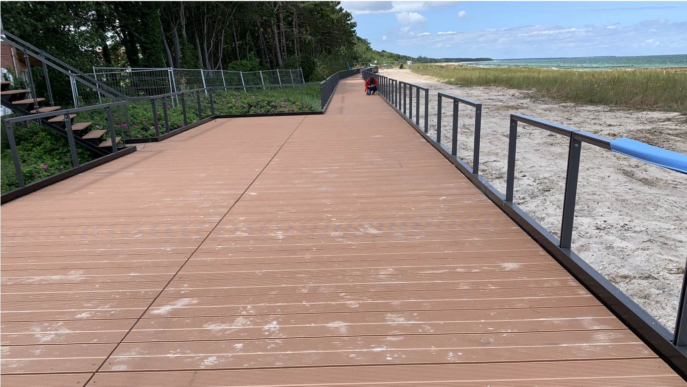
Verrottungsbeständiges, glasfaserverstärktes Kunststoffbaumaterial mit allgemeiner bauaufsichtlicher Zulassung

Aus der Serie TRIMAX von TEPRO Kunststoff-Recycling