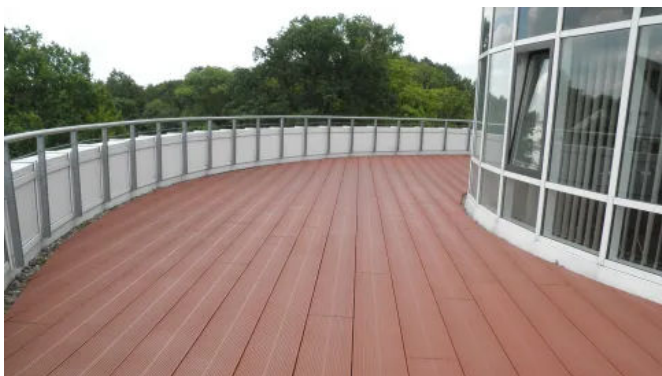
Sanierung der Dachterrasse am Rathaus in Uelzen mit TRIMAX®-Riffelbohle in rotbraun