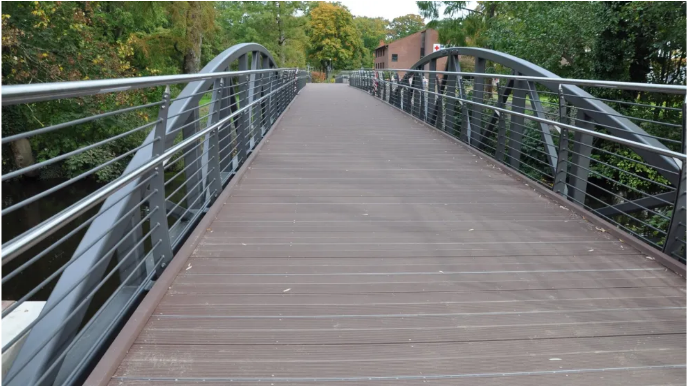
Neubau der Langen Brücke in Uelzen mit Belag aus 5 cm dicken TRIMAX® Riffelbohlen aus Kunststoff mit einer Breite von 30 cm

Aus der Serie TRIMAX von TEPRO Kunststoff-Recycling