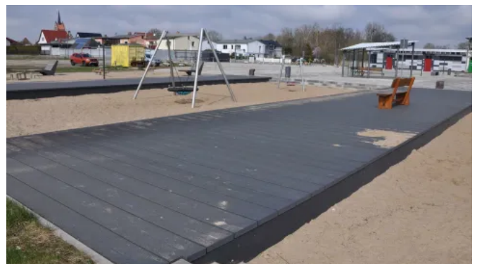
Gestaltung der Spielflächen im Usedomer See-Zentrum mit TRIMAX®-Bohlen mit geriffelter Oberfläche