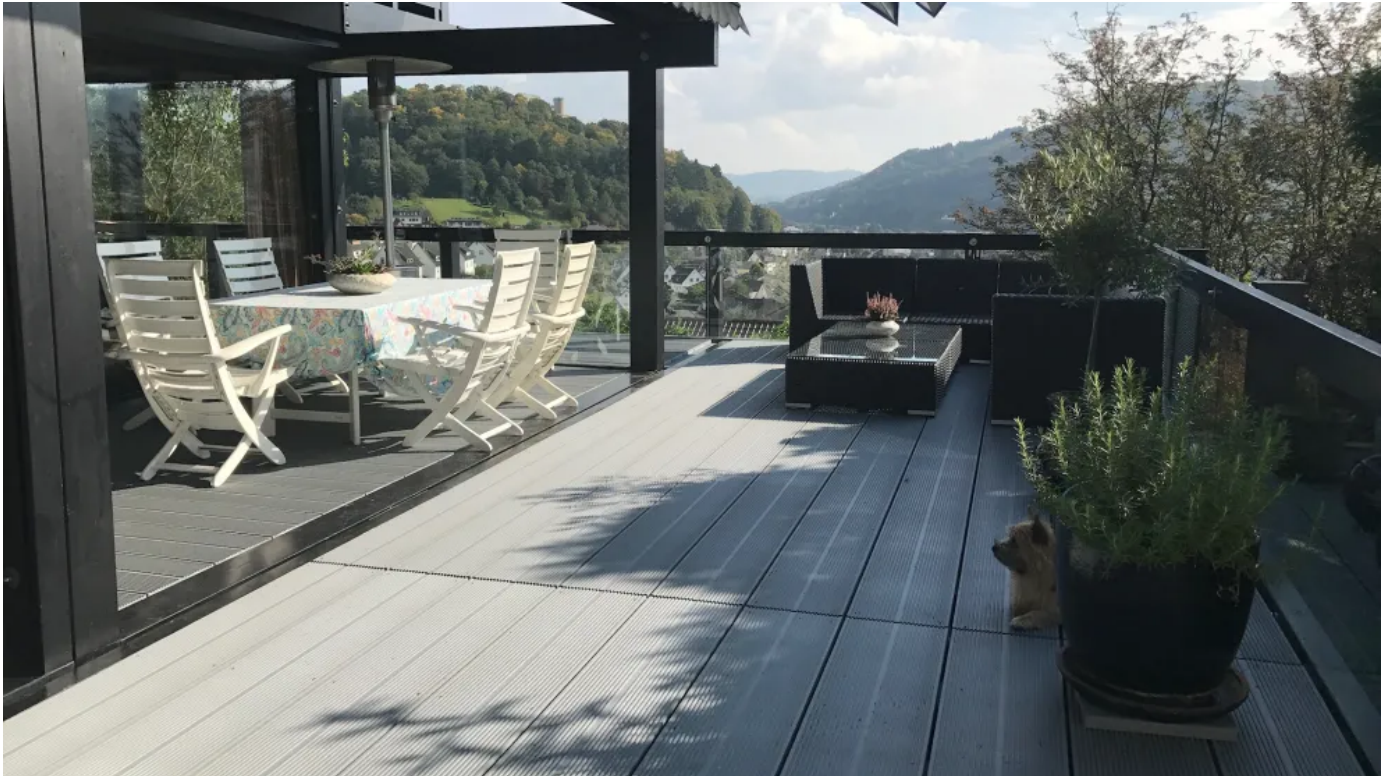
Mit glasfaserverstärkten TRIMAX®-Terrassendielen aus Kunststoff belegte Terrasse mit Ausblick in den Naturpark Lahn-Dill-Bergland