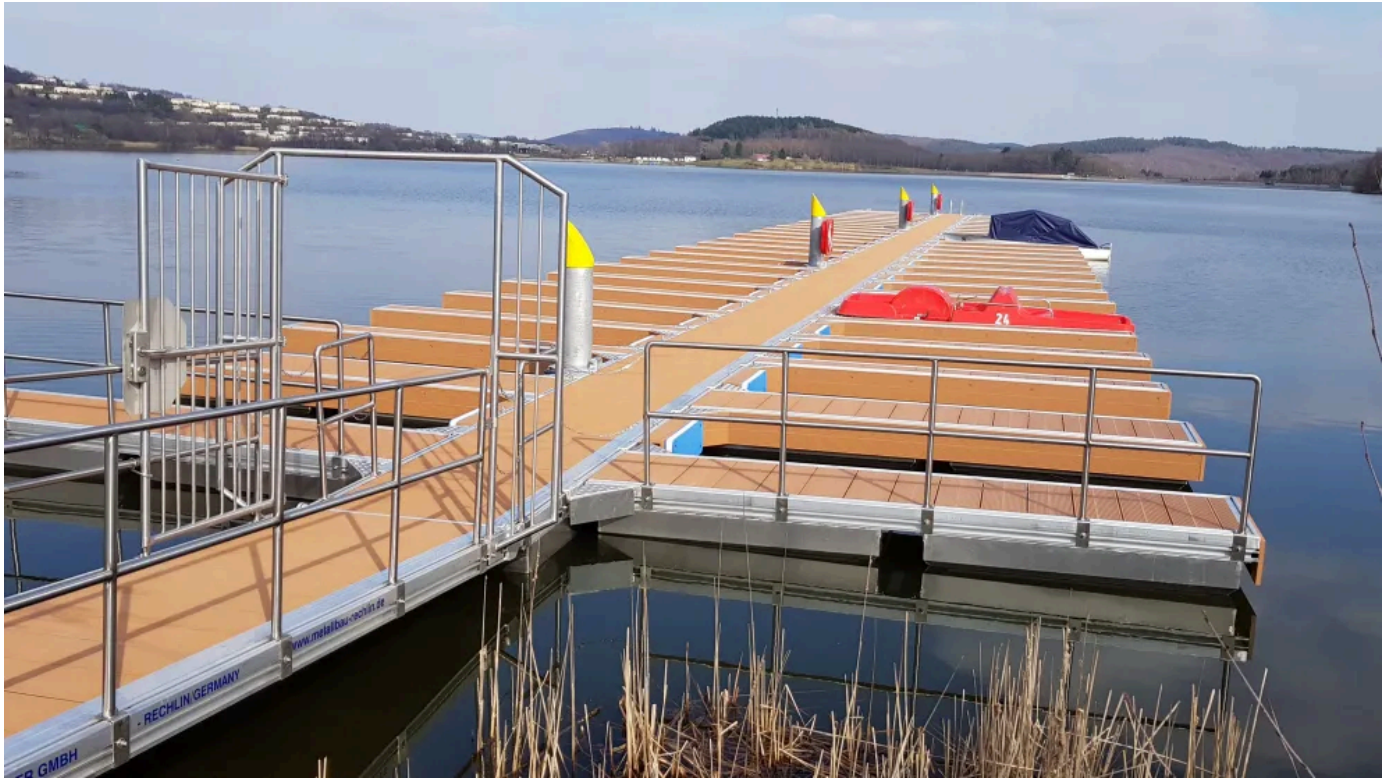
Erneuerung der Schwimmteganlage am Bostalsee: Die Belagsbohlen TRIMAX® nehmen kein Wasser auf und verrotten somit nicht

Aus der Serie TRIMAX von TEPRO Kunststoff-Recycling