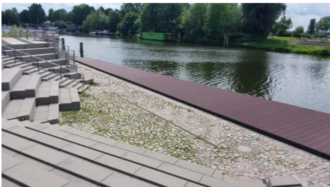
Sanierung der 180 m 2 großen Seebühne in Geesthacht mit langlebigen TRIMAX® Kunststoff-Bohlen 5 x 30 cm in Dunkelbraun