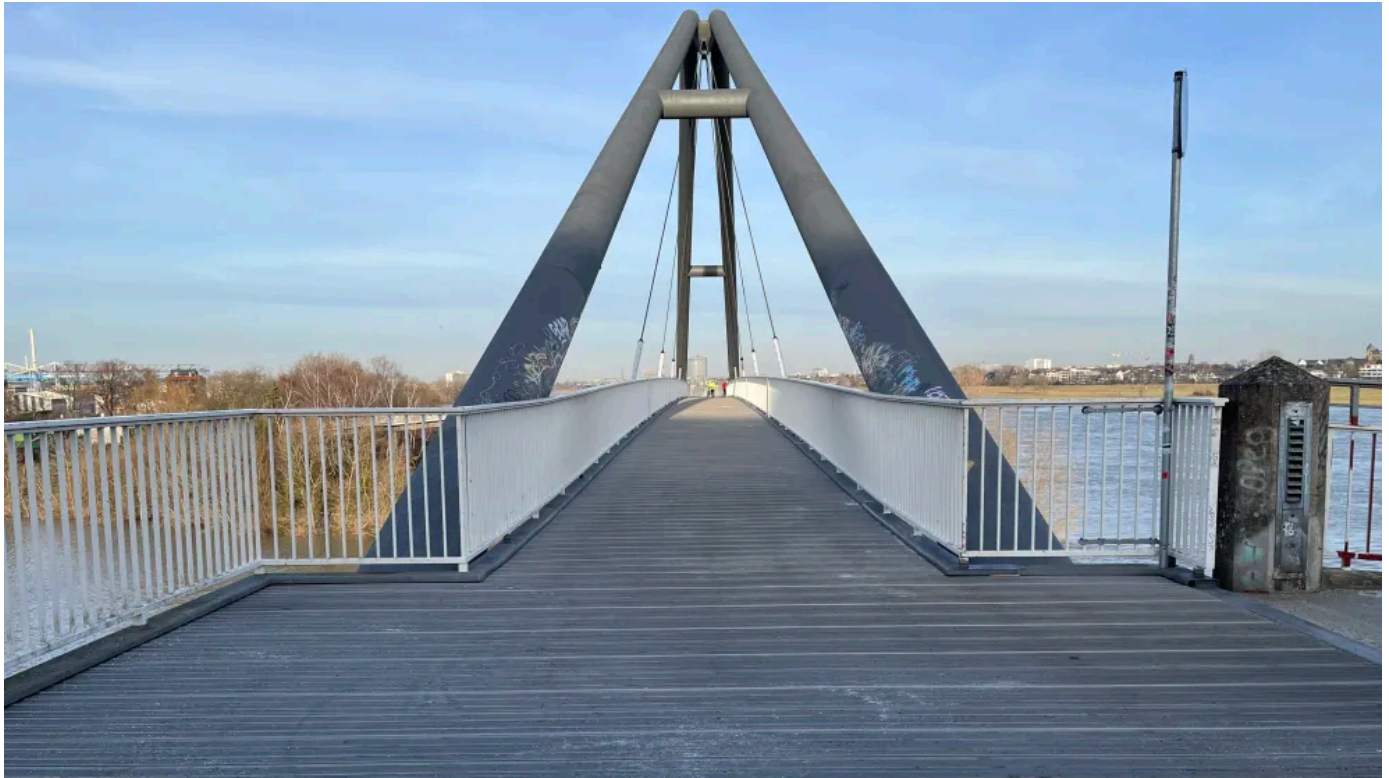
Sanierung der Brücke am Medienhafen in Düsseldorf mit TRIMAX® Kunststoffdielen mit geriffelter Oberfläche in grau

Aus der Serie TRIMAX von TEPRO Kunststoff-Recycling