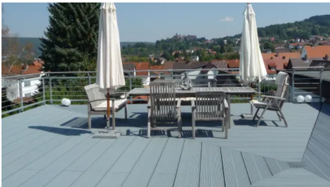
Sanierte Dachterrasse in Kulmbach mit TRIMAX® Terrassendielen 3 x 30 cm aus Kunststoff im Farbton Grau