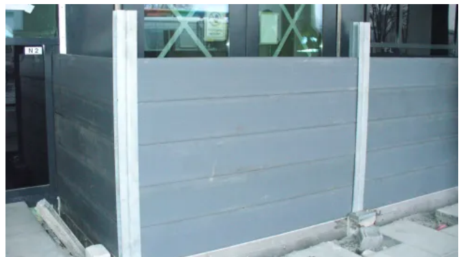
Beim Hochwasserschutz kommen regelmäßig die Nut- & Federprofile in der Dimension 5 x 25 cm zum Einsatz.