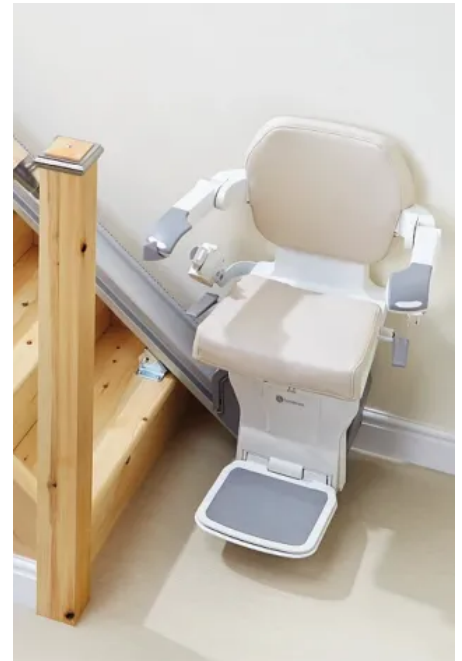
Handicare 1000 ist ein besonders schlanker Treppenlift, der sich für schmale Treppen eignet.