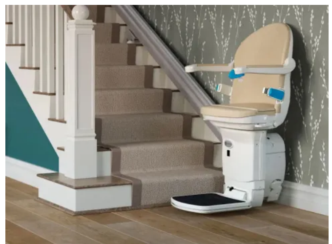
Handicare 1000 mit 4-Punkt-Sicherheitsgurt