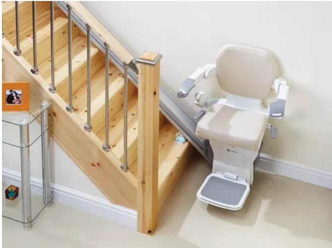
Die klappbare Schiene des Handicare 1000 wird direkt auf den Stufen montiert und enthält je einen Ladepunkt oben und unten für den 24V Akkubetrieb.

Aus der Serie Liftlösungen von Savaria Deutschland