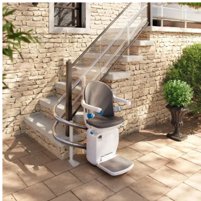
Der Handicare 4000 ist stabiler Kurventreppenlift, der mit verchromter Doppelschiene, wasserdichter Abdeckung (Schutzart IP44) und UV-geschützten Outdoor-Sitz für den Einsatz im Freien geeignet ist.

Die platzsparende Freecurve Einrohr-Schiene (Ø ca. 76 mm) wird je nach baulicher Situation als Innenläufer, Außenläufer oder Mehr-Etagen-System ausgeführt. Für sehr schmale Treppen steht die Zwei-Wege-Drehfunktion zur Verfügung: der Treppenlift fährt mit leichter Neigung nach hinten, sodass die Knie ausreichend Abstand zur Wand haben.