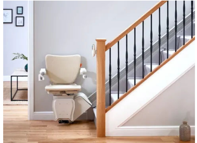
Der Handicare 1100 verfügt über einen wartungsarmen und komfortablen Friktionsantrieb, eine intuitive Bedienung und die derzeit schmalste Schiene am Markt.