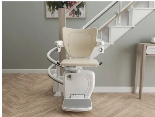
Der Treppenlift Handicare 4000 bietet Komfort- und Sicherheitsfeatures wie die automatische Sitz-Drehfunktion und automatische Klappschiene.