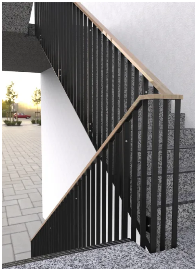
Treppengeländer SCALA mit Handlauf in Holzoptik