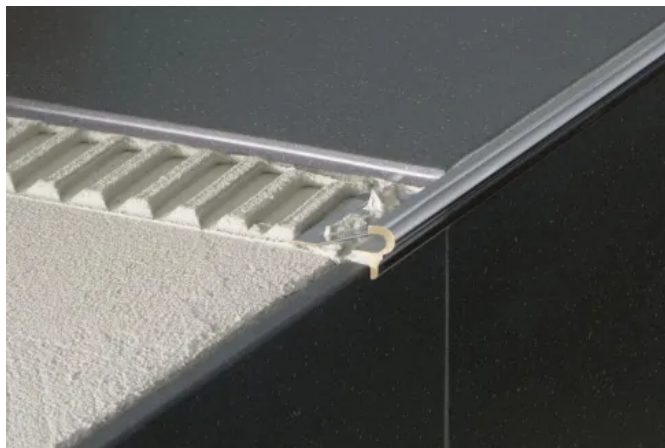
BBLANKE DEKO-STUFENKANTE FLORENTINER

Dekorative Gestaltung von Treppenstufen bei gleichzeitigem Schutz der Kanten vor Abschieferung und mechanischer Beschädigung.