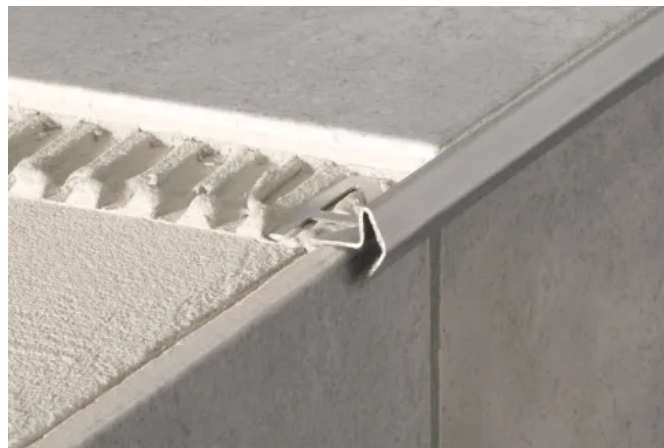
BLANKE DEKO-STUFENKANTE MODERN

Technisches Datenblatt BLANKE DEKO-STUFENKANTE FLORENTINER